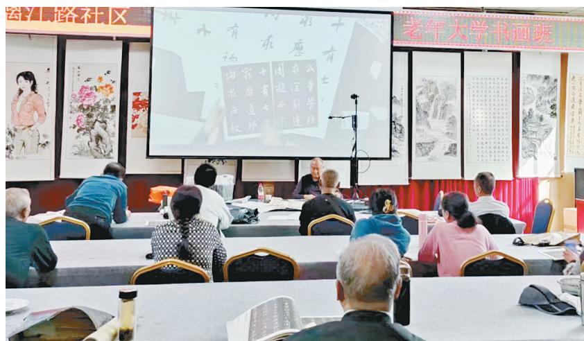
天桥街道老年大学的书法课堂。