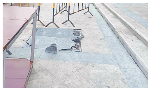
颍山路与滨河西路交叉口向南约60米路西,井盖破损。

我是创文啄木鸟 如发现身边的不文明行为,可扫描左侧二维码下载漯河发布APP进行爆料。