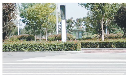
丹江路与翠华山路交叉口,交通信号灯不亮。