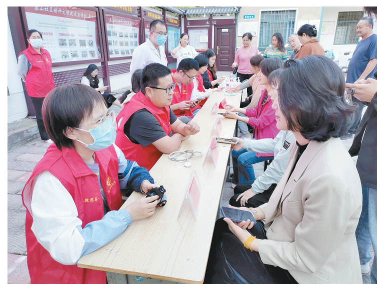
10月10日下午,郾城区沙北街道泰山社区联合市第二人民医院在辖区开展义诊,让居民在家门口享受便捷的医疗服务。