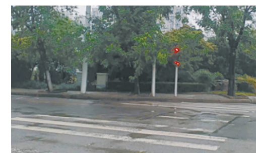
湘江西路与创业路交叉口,树枝遮挡交通信号灯。