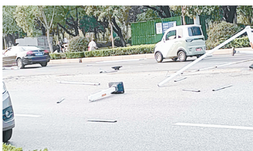
淞江路与井冈山北路交叉口向东约200米,交通护栏损坏。