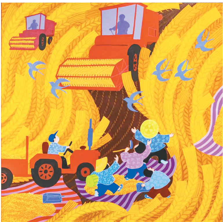
丰收乐(农民画)(获“翰墨润中原”河南省美术作品大赛优秀奖) 任明兆作