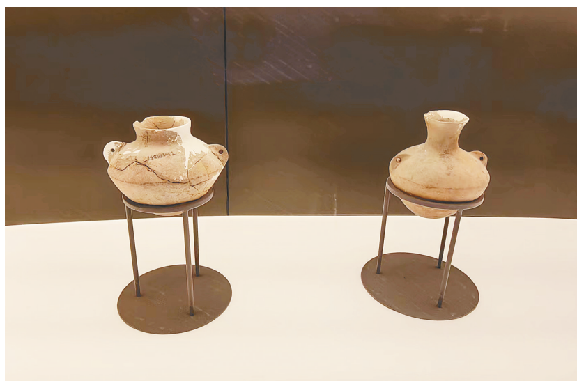
贾湖遗址出土的盛酒陶器。