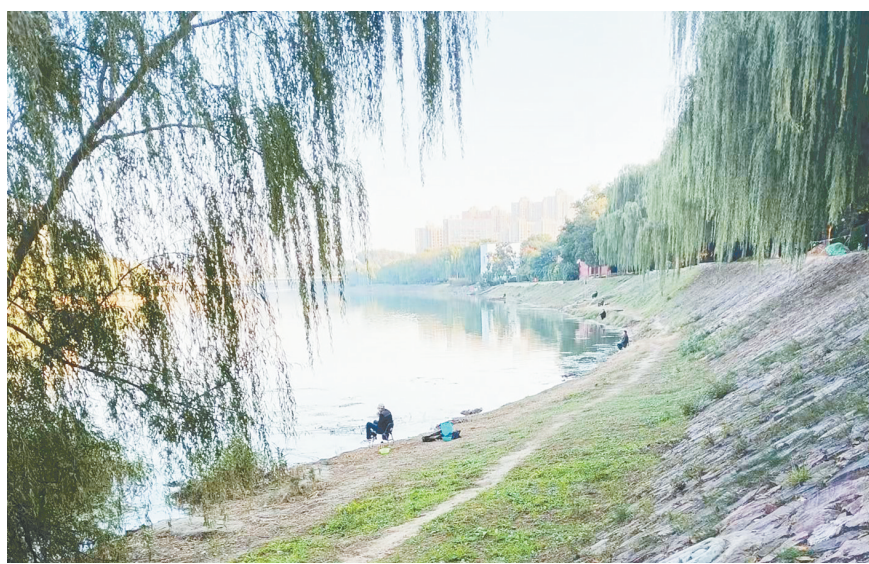
如今的“母猪圈”风景如画。

记者在翟庄街道冯庄村走访时,看到村委会门前的文化墙上有“冯庄村的来历”的民间传说:“母猪圈”位于冯庄村西南沙河向北拐弯处,全长1000米,冯庄村村名的来历源于“母猪圈”。故事梗概为:古代,沙河流经此处时形成一个窝,一头母猪精在此坐