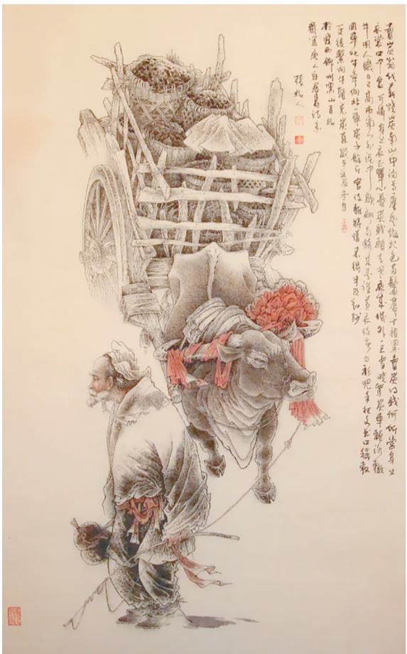
《卖炭翁》(国画) 戴敦邦 绘

冬季天气寒冷,在生产力落后的古代,人们取暖所用的燃料是什么?各个朝代又采取了哪些措施来保障燃料供应呢?