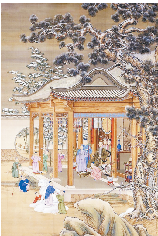
《弘雪景行乐图》(清) 郎世宁 绘