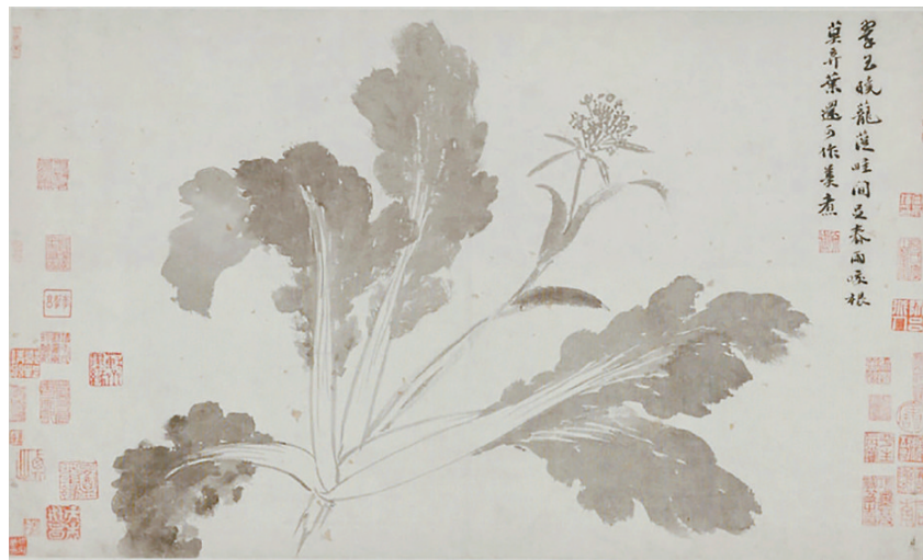
《辛夷菜菜图》(明) 将一探普普通通的菜表现得栩栩如生。沈周 绘

“渐觉东风料峭寒,青黄韭韭试春盘。”苏轼在《送范德孺》一诗中如是说。他在渐渐寒冷的日子里感受到初春的气息,试着摆放青蒿和黄韭,以期迎接春天的到来。孟元老在《东京梦华录》中记载:“十二月,街市尽卖撒撒花、韭黄、生菜、兰芽……”陆游在《与村邻聚饮》诗也说:“鸡跖宜蔬白,豚肩杂韭黄。”这说明在宋代,人们能使用温室种植韭黄、芽菜等稀有蔬菜。而《东京梦华录》的记载则说明,温室种植已经不再是少数权贵的专利,普通百姓也能吃到了,以至于街市上都有售卖。