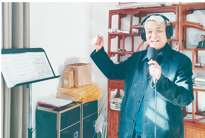
辛海生演唱自己创作的歌曲