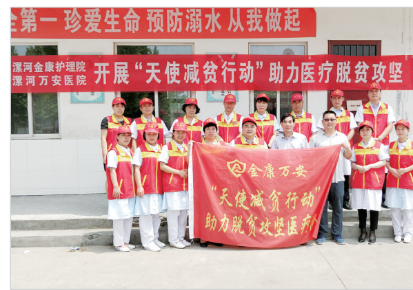
志愿者团队积极参加社会公益活动。