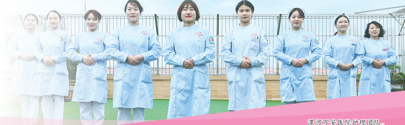
漯河万安医院护理团队。