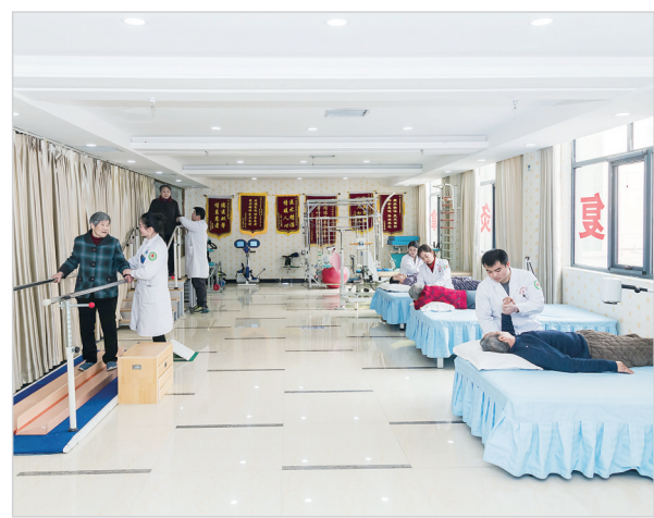
漯河万安医院康复治疗室。