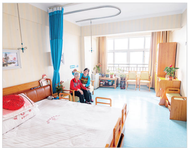
漯河万安老年公寓起居室。