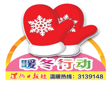
漯河日报社 温暖热线：3139148

此外，志愿者们还走进源汇区、召陵区、舞阳县、临颍县的10户困难家庭，送去爱心物资和诚挚的问候。活动中，困难家庭纷纷表达了感激之情。