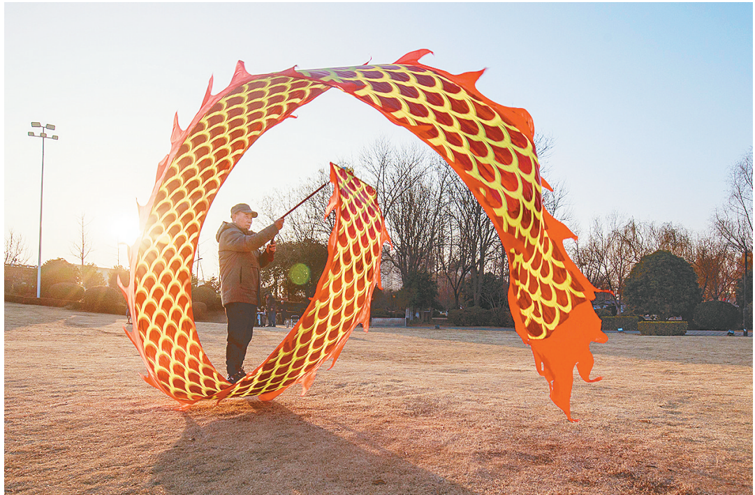
1月4日，我市天气晴好，空气质量良好，非常适合户外活动。当天下午，不少市民走出家门，到沙澧河风景区、街头游园等处游玩、锻炼身体。

召陵区农村公路管理所加强作业过程监管，严把把控施工质量，每个环节都做到精细，确保修后的路面平整结实。同时，做好施工现场安全监管和环保工作，作业人员身着安全标志服装，施工现场设置安全警示标志和防护设施；严格控制施工扬尘，铣刨废料随时清理，减少施工扬尘污染。截至目前，该所已完成修复工作。