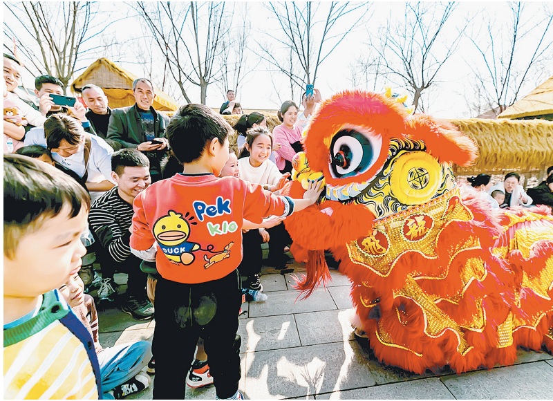
游客正在观看舞狮表演。