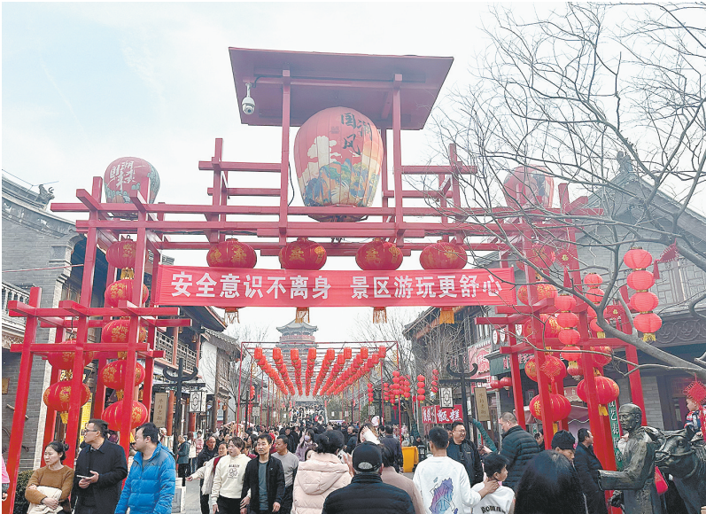
漯湾古镇游人如织。