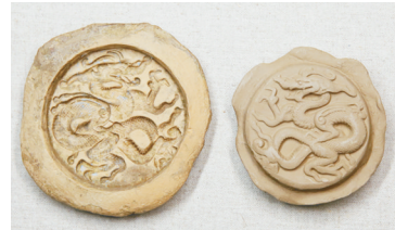
龙纹陶范(金),长3.6厘米,宽3.4厘米,厚0.9厘米。该范呈圆形,主题纹饰雕刻成盘龙状,张口、舞爪、眦目前视,通体饰纹。龙爪、鳞片雕刻细腻。