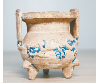
珠华釉龙纹香炉(明),口径10.5厘米,高12.7厘米。