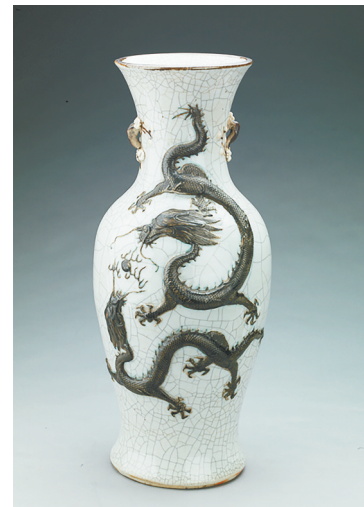
哥釉贴塑龙纹瓷瓶(清),口径18厘米,足径18厘米,高56.2厘米。