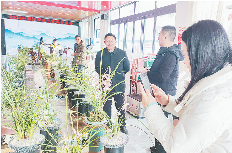
参加春兰赏花交流会的市民在赏花、拍照。

典雅高洁、幽香四溢的兰花竞相绽放,吸引了不少摄影爱好者。“兰花给人一种超凡脱俗、清新优雅的感觉。看到这么美的兰花,我心情非常舒畅,必须