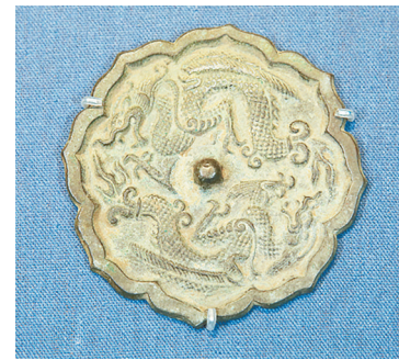
双龙纹菱式铜镜(宋),直径9厘米,厚0.4厘米。该镜呈八出菱花形,镜背为半球形钮,以钮为中心,饰二对称头向相反的蟠龙图案。

今年是甲辰龙年。龙自古即为中华民族的象征,是中华文化中极为古老而又尊贵的祥瑞之兽。市博物馆现有馆藏文物2000多件,其中有不同质地龙纹图案文物数件。这些文物上“龙态”各异,有的昂首长啸,有的云龙盘旋,展现了龙的神秘与力量。让我们一起来欣赏这些龙文物、品味龙文化吧。