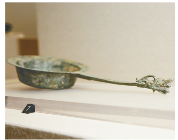
龙首柄铜双斗(汉),口径15厘米,通柄长31.9厘米。