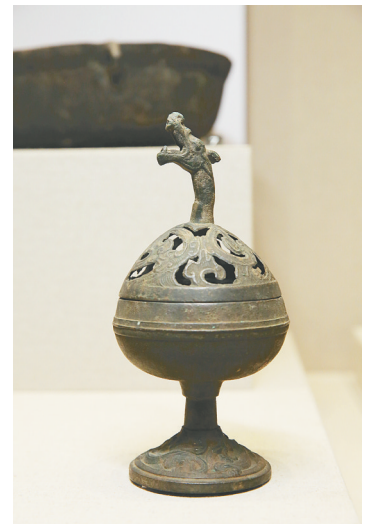
龙首铜熏炉(汉),通高15.8厘米,口径11.2厘米,底径8厘米。