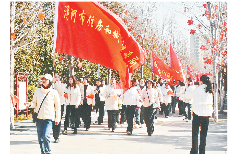
3月8日,我市迎“三八”巾帼健步行活动在红枫广场举行。来自市直及驻源单位、女性社会组织的2000余人参加了活动,共同庆祝“三八”国际劳动妇女节。