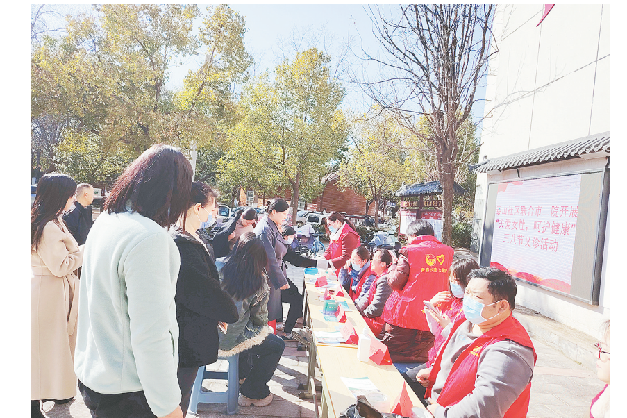
3月8日,郾城区沙北街道泰山社区联合市二院开展“关爱女性 呵护健康”义诊活动。