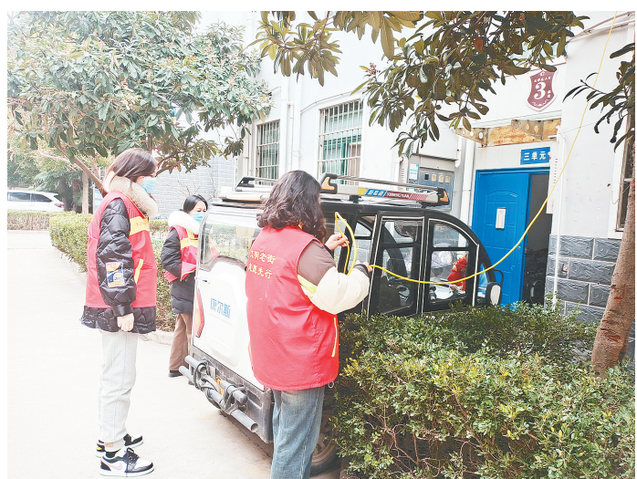
3月5日,源汇区老街街道滨西社区在辖区背街小巷、住宅小区和高层楼宇开展安全隐患大排查。

简讯 ●近日,源汇区顺河街街道建设西路社区开展电动车专项治理整治。 ●3月7日下午,源汇区团办举办了职工趣味运动。 梁三阁 马桂华