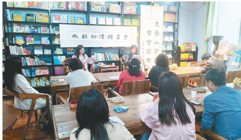
读书分享活动现场。