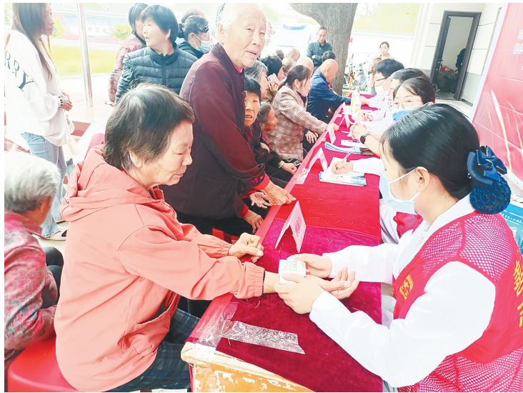
↑4月28日，由市政府妇儿工委办、市卫健委、市妇联、市总工会联合实施的“母亲健康快车续航行动”走进舞阳县莲花镇长村赵村，开展义诊活动。本报记者 杨旭 摄 ↑4月28日，漯河火车站团委、安全技术科工作人员走进铁路沿线学校开展爱路护路主题宣传活动。本报记者 杨旭 摄

今年以来，市城乡一体化示范区立足防大汛、抗大旱、抢大险、救大灾，坚持问题导向，找差距、补短板、强基础，扎实做好防汛各项工作，力求做到“汛前有准备、险来有措施”。 完善指挥体系，提升处置能力。汛前调整充实各级防汛抗旱指挥机构，加强值班值守，第一时间发布灾害性天气预警和防御部署信息。及早会商部署，按照“早、实、细、全”要求，做好抗旱供水与汛前安全检查工作。细化工作要点，印发防汛抗旱应急预案，进一步完善极端天气的部门工作指引及预警、响应联动机制。核实更新地质灾害点、危旧房屋、低洼地带等危