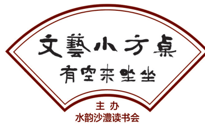
主办 水韵沙颍读书会

“文艺小方桌”活动负责人表示,从本期起,公益讲座将每月举办一期,讲述与漯河相关的历史名人,旨在让更多人了解漯河、走进漯河,创作出更多富有漯河本土文化特色的作品,提高城市知名度和美誉度,以更丰富的视角讲好漯河故事,展现漯河魅力,助力现代化漯河“三城”建设。