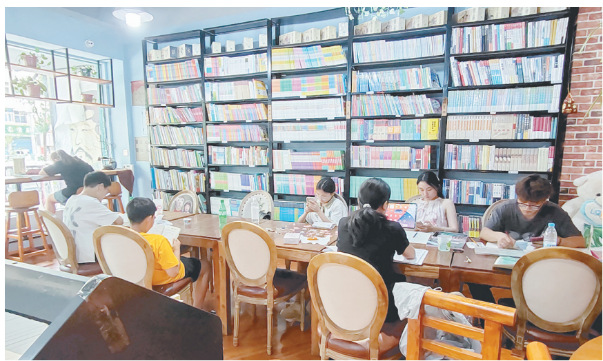
学生在市区一家书店阅读。

■文/图 本报记者 尹晓玉 见习记者 张赢 暑假来临,度过一个有意义的假期是孩子、家长、老师共同追求的目标。为了让与孩子好伴,尽情享受假期的美好时光,近日,市图书馆及各大书店都已做好准备,在假期为孩子们营造良好的阅读氛围,为城市增添书香。 6月23日,记者走进市图书馆,看