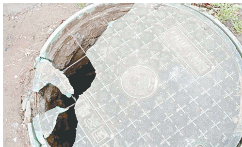
滨河西路与太行山南路交叉向西约60米路南,电力井盖破损。