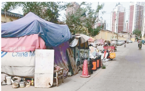
华南西巷与交通南路交叉口向西约150米,路边堆放杂物。