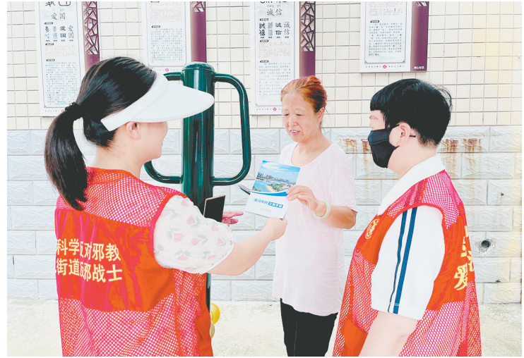
7月8日,郾城区沙北街道嵩山社区组织志愿者向居民发放市民文明手册。

费的电影看。这个假期,我每天都要来看。” “从7月1日开始,场场爆满。”市人民会堂负责人说,“接下来,我们将全力以赴做好服务,让孩子们快乐观影。” 据了解,已连续开展十余年的“幸福漯河少年”公益电影暑期放映活动,是“幸福漯河”系列公益文化活动品牌之一,曾入选河南省公共文化服务体系建设项目。今年7月1日至8月31日每天下午4点,市人民会堂都会面向公众放映一部公益电影,让孩子们度过一个轻松、快乐、有意义的暑假。