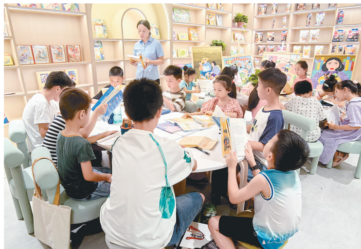
7月7日,孩子们在市新华书店马路街购书中心参加“新华阅读公开课”活动。

骑行到叶县。 “喝北舞渡胡辣汤,游叶县县衙,打卡洛阳龙门石窟……骑行前两天,我们看美景、品美食。两个孩子兴致盎然,都说开阔了眼界、增长了见识。”田旭辉说。 田旭辉告诉记者,此次骑行在省、国道。他的安全压力很大。骑行过程中,两个孩子都在他的视线范围内。他们计划每天骑行百公里左右,每天上午9点出发,中午就餐后休息2个小时,下午3点再次出发。从第三天开始,两个孩子的屁股都磨出了水泡。一路欢声笑语的骑行开始变得沉闷了。 “当时,别说孩子了,我屁股也被磨得生疼,不敢坐车座,想打退堂鼓。作为父亲和舅舅,在困难时刻,我更应该发挥表率作用,增强孩子们战胜困难的信心。我们调整了骑行时间,从三门峡到灵宝再到渭南,多停、多补给,经受了后来200多公里的考验。”田旭辉说。 据田旭辉介绍,这次骑行,微信朋友圈家人和朋友的密切关注和鼓励,成为他们的动力。让他感到欣慰的是,这次骑行使两个孩子得到了锻炼。他们学会了关心别人,积极克服困难,增强了信心。