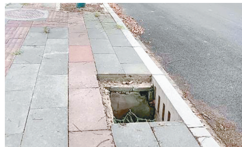
云翠山路与牡丹江路交叉口向北约50米路东,雨水井盖缺失。