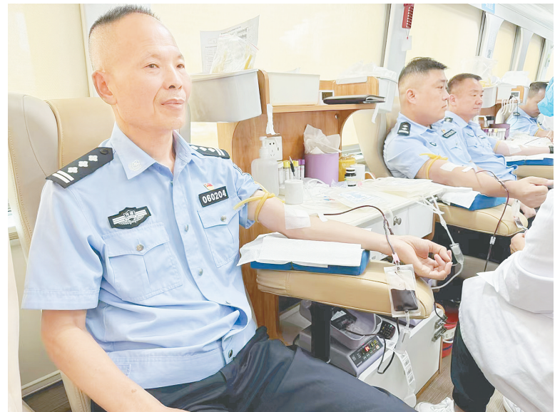
8月7日,临颖县公安局开展无偿献血活动。百余名民(辅)警积极参与。

门负责人组成的初评团队从清晰阐明事实、认定有力、准确释法说理、论证有据、文书格式规范、语言精准等多个角度进行了初步筛选与综合评估。随后,领导班子成员组成复评组,经过层层筛选,最终评选出了两份优秀法律文书。 董新丽