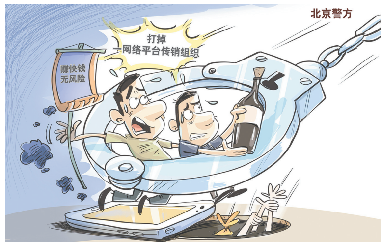
近日,北京市公安局经济犯罪侦查总队打掉一网络诈骗传销组织,抓获犯罪嫌疑人26名。该组织以“赚快钱、无风险”为由拉拢人员参与,构建庞大传销网络,案发时参与人员达5000余人,涉案资金逾10亿元。 据新华社

负责本案的律师表示,误工费是指被侵权人因受到人身损害导致不能进行正常工作或正常经营活动而减少的工资收入或者经营收入。认定受害人是否存在误工损失,应当根据受害人因伤导致的误工时间以及收入状况确定。 本案中,小勺系临近毕业的大学生,毕业之前由于正在上学未参加工作而无工资或经营收入。因小勺未举证证明其在校期间有工资或经营收入,故对于2022年6月14日至2022年7月1日,即交通事故发生之日至小勺毕业之日的17天,法院未支持这一期间的误工费。案涉交通事故造成的人身损害会对小勺毕业后正常就业造成影响,进而导致其可能获得的工资或经营收入有所减少。因此,支持其大学毕业之后的误工费较为公平合理。 李刚 蒋丽婷