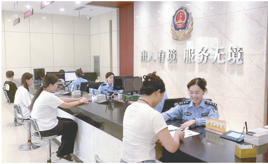
市公安局出入境接待大厅,工作人员正在有序给市民办理证件。

同时,全市出入境管理部门工作人员提供延时、错时服务,每周六上班为群众办理出入境业务。窗口工作人员延长办公时间,利用中午休息和下午下班时间,上传受理材料,力争当日业务当日办结,确保申请人如期出行;实行证