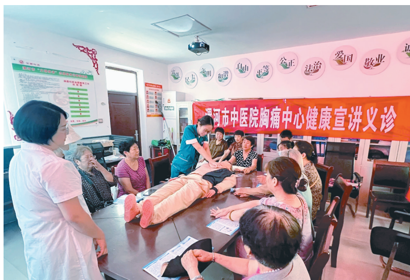
8月15日至16日,市中医院胸痛中心医务人员分别到滨西社区和受降路社区开展进社区健康宣讲义诊活动,旨在提高社区群众对胸痛的认识及自救、互救能力。