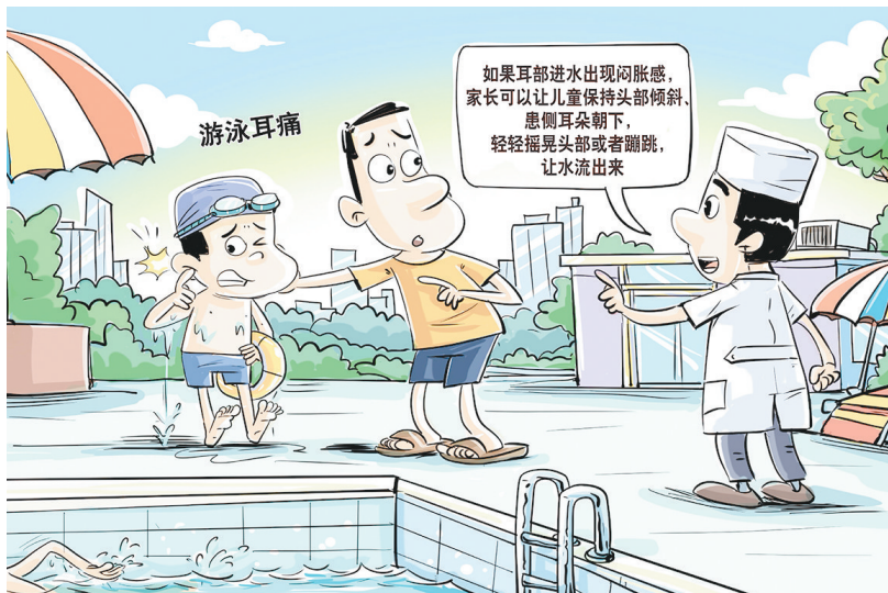
暑假期间,不少家长选择带孩子游泳消暑降温,但一些孩子在游泳过程中或游泳后出现耳痛症状。 儿童游泳时出现耳痛如何应对?如果耳部进水出现闷胀感,家长可以让儿童保持头部倾斜,患侧耳朵朝下,轻轻摇晃头部或者蹦跳,让水流出来。

张昱说,哮喘患者在日常护理中要了解诱发哮喘的外部原因,进行针对性预防。建议患者注意饮食规律和穿衣保暖,尽量戒烟戒酒,保持居住环境整洁,避免与可能的过敏原接触。同时,患者应与医生及时沟通,定期做血常规、肺功能等检测,通过针对性治疗降低体内炎症水平。 据新华社