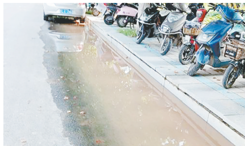
太白山路与丹江路交叉口向南约50米路东，苏荷棠工地门前污水横流。