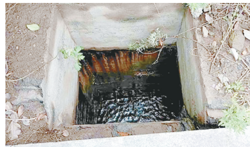
嫩江路与太白山路交叉口向西约150米路南，绿化带内污水井盖移位，存在安全隐患。