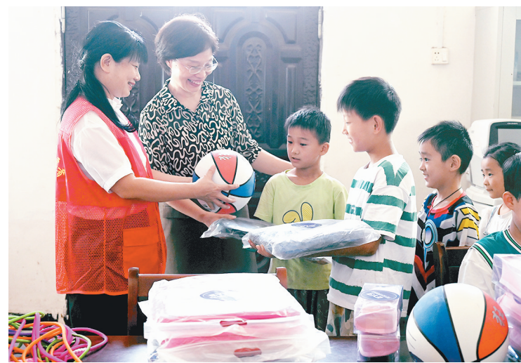
8月22日，源汇区妇联联合一家眼科医院组成巾帼志愿者服务队，到问十乡前问十村开展关爱留守儿童活动。