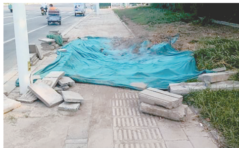
燕山路与赣江路交叉口向南约150米路西，施工后路面未恢复。