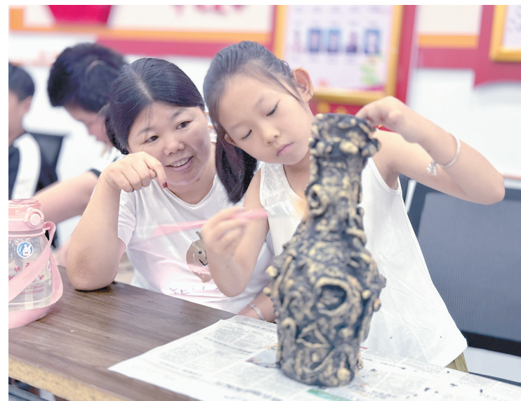
8月22日，源汇区顺河街街道泰山中路社区居委联合颍阳书院开展亲子欢乐志愿公益公益活动。图为家长和孩子利用简易物品模仿制作青铜器。

平板电脑、打印机、水笔、A4纸……李女士说，一部分是她选的，一部分是孩子自己挑选的。“平时工作忙，也没时间带孩子逛市场，在网上选购还是比较方便的。”李女士说。