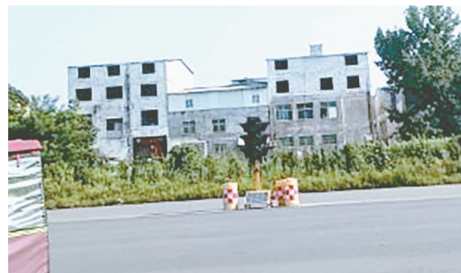
市区龙江东路与燕山路交叉口，交通信号灯不亮。