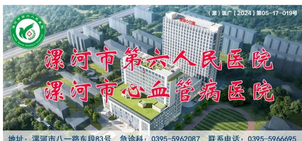
地址:漯河市八一一路东段83号 急诊科:0395-5962087 联系电话:0395-5966695