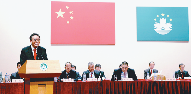
2013年2月21日，吴邦国同志在澳门文化中心出席澳门社会各界纪念澳门基本法颁布20周年启动大会并发表讲话。