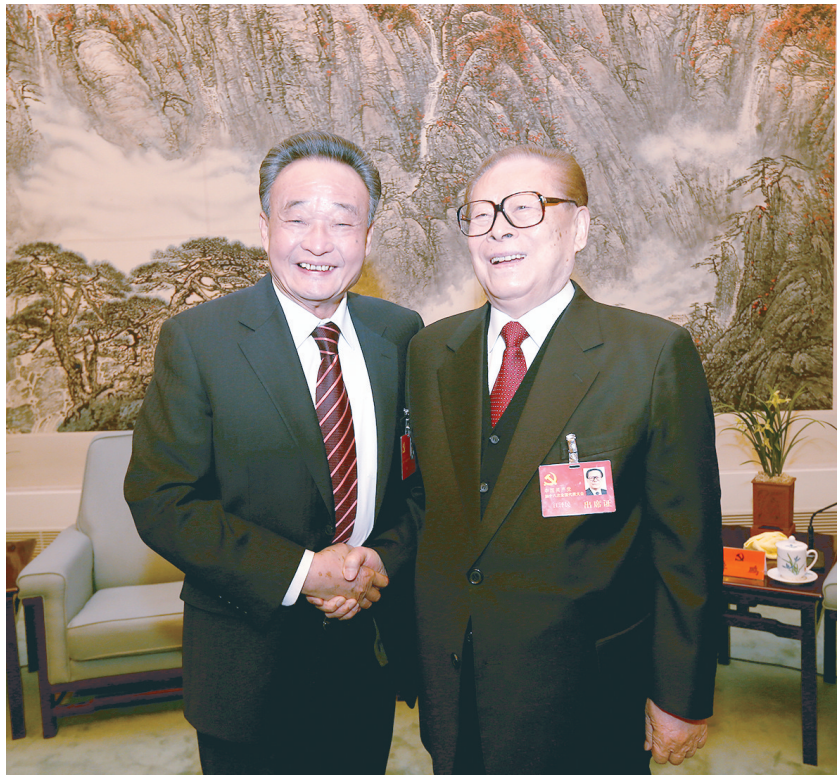
2012年11月14日，中国共产党第十八次全国代表大会在北京闭幕。这是闭幕会前，江泽民同志与吴邦国同志在一起。