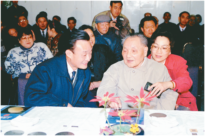
▲1992年2月10日，邓小平同志在上海贝岭微电子制造有限公司参观时与吴邦国同志交谈。