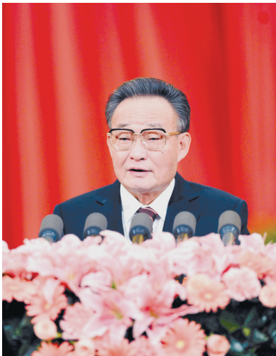
2011年3月10日，十一届全国人大四次会议在北京人民大会堂举行第二次全体会议。吴邦国同志作全国人民代表大会常务委员会工作报告。