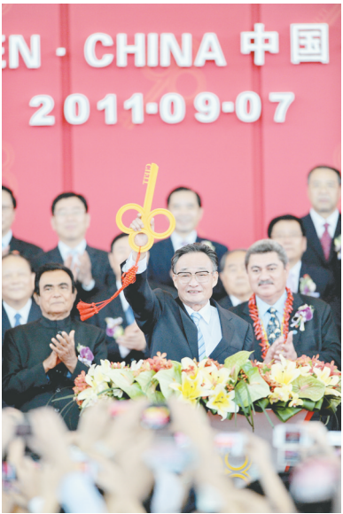
2011年9月7日，吴邦国同志在福建厦门出席第十五届中国国际投资贸易洽谈会开幕式。