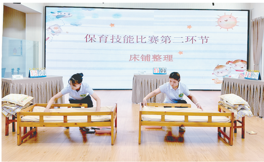
10月18日，市实验幼儿园举行保育老师技能大赛，以提升保育老师的专业技能和综合素质，促进保育工作规范化、精细化。