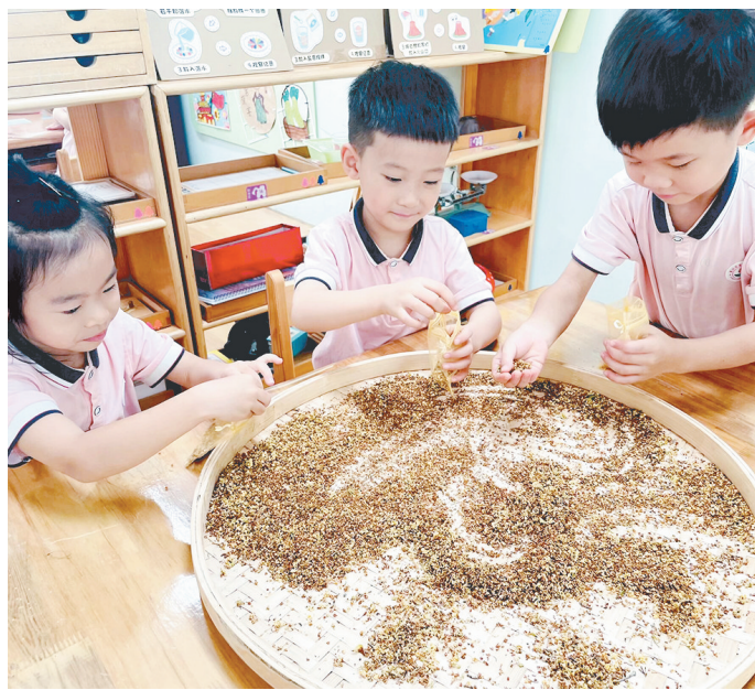
近日，市实验幼儿园以“赴一场桂花盛宴”为主题开展班级系列活动，让孩子们了解桂花的相关知识。