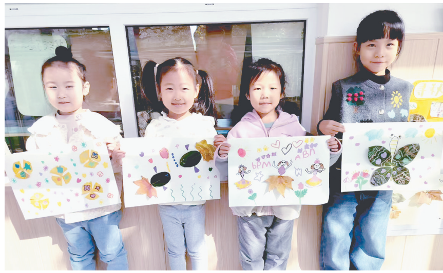
10月23日，郾城区实验幼儿园以“时逢霜降 趣满深秋”为主题开展了丰富多彩的霜降节气系列活动。图为孩子们展示自己制作的树叶贴画。