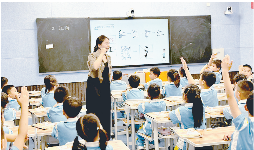
10月9日~10月17日，源汇区实验小学举行了“践行新课标 构建新课堂”优质课大赛暨一年级教学开放周活动。