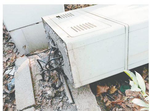
黄河东路与庐山路交叉口西北角，通信交接箱倒地。