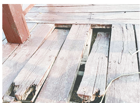
交通北路与淞江路北辅道交叉口向北，淞江湖公园内栈桥上多处木板翘起、松动。