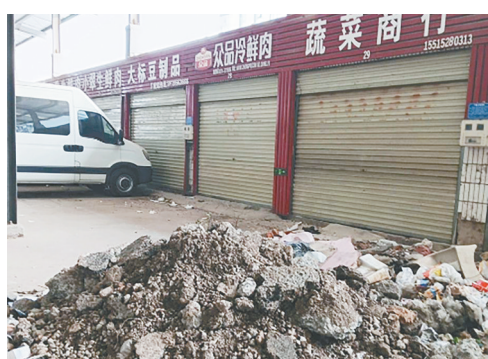
育才路农贸市场与尚武街交叉口向东约100米路南，垃圾渣土堆积。