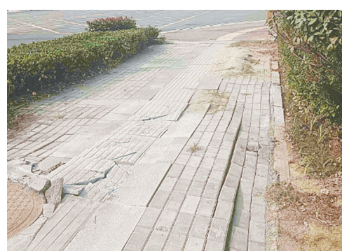
牡丹江路与解放北路交叉口向东约120米路北，人行道上地砖破损。