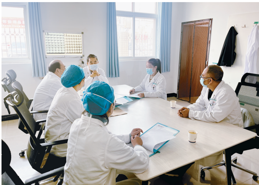
市中心医院医疗健康集团医疗工作领导小组成员对近期的查房工作进行讨论。

讨论会上,大家各抒己见、畅所欲言,都在汇报工作情况、提出意见建议、优化规章制度。这样的讨论会、“碰头会”每次都有新收获、新成