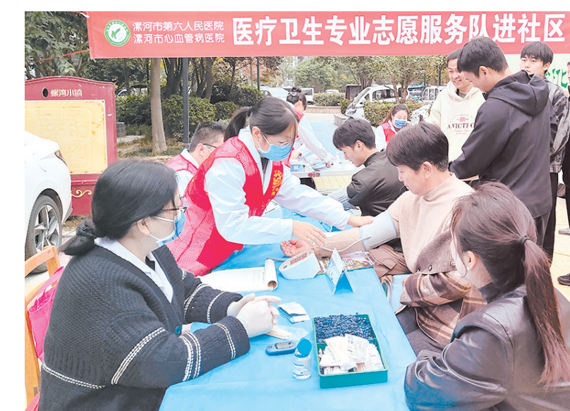
11月8日上午,漯河市心血管病医院(市六院)医疗专家志愿服务队到源汇区螺湾小镇开展“老年服务品牌送健康”义诊。