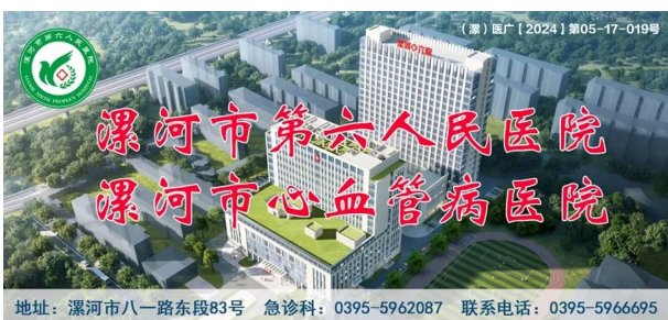
地址:漯河市八一东路东段83号 急诊科:0395-5962087 联系电话:0395-5966695