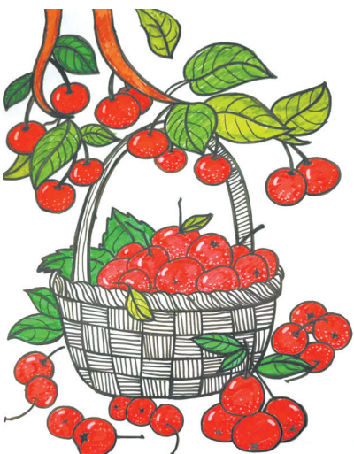
本版组稿：孙建磊 陈思盈

爱人说，等明年春天到来，也要在老家种一棵山楂树。树还没种下，我已经满心期待。在几年后的某一天，当开满小花或是缀着一簇簇红艳艳果子的山楂树出现在眼前时，我的心又会是怎样的繁花似锦呢？