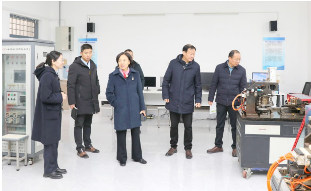
2024年河南省高水平中等职业学校和专业建设工程验收