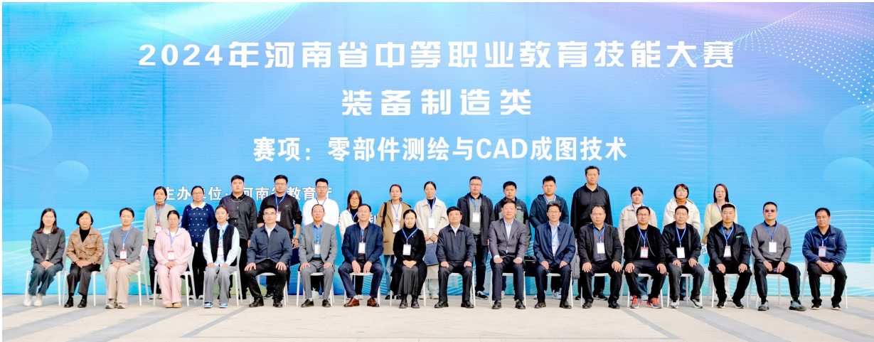
学校承办的2024年河南省中等职业教育技能大赛零部件测绘与CAD成图技术赛项

花红全靠育花人。打造一支稳定的、业务过硬的专业教师队伍尤为重要。近年来，漯河第一中专通过抓师德师风建设端正教风，抓教研提升教师专业素养，完善激励机制激发教师干事创业活力；通过线上、线下学习公共基础课“三教改革”、专业课“岗课赛证”教学模式的改革与创新，全面提高教师综合素养；重视“双师型”教师的人才引进和培养，全力引进硕士研究生，公开招聘专业教师，进一步优化教师队伍结构；鼓励教师积极参加职业技能鉴定、技术职务评审，积极参加技能培训、到企业跟班学习；大力实施“青蓝工程”，充分发挥高级教师、市级骨干教师、专业带头人的“传、帮、带”作用，快速提升年轻教师的教育教学水平和专业素养。 这一系列举措，促使一支学识渊博、爱岗敬业的教师队伍逐渐成长起来。该校现有正高级讲师3人，全国模范教师1人，全国优秀共青团干部1人，中原教学名师1人，省职业教育教学专家1人，省优秀管理人才2人，省级专业教学名师10人，“双师型”教师达86%以上，省、市级名师工作室4个，开发了12门精品课程，研发了16种校本教材，转化大赛成果18项。