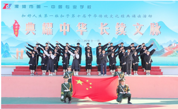
第十届中华优秀传统文化经典诵读活动

近日，漯河市第一中等专业学校（以下简称漯河第一中专）以优质的教育资源、先进的教学理念和丰硕的育人成果，被教育部评为2024年全国教育系统先进集体。 技能是强国之基、立业之本，技能人才是支撑制造强国、质量强国建设的宝贵资源。近年来，漯河第一中专不断培养符合经济社会发展的高技能人才，为国家输送了一大批优秀职业技术人才。一批批优秀学子从这里奔赴各行各业，实现人生理想。