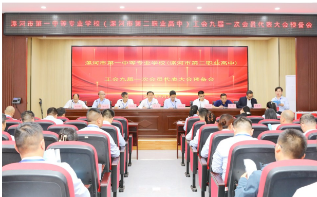
学校九届一次教职工代表大会召开