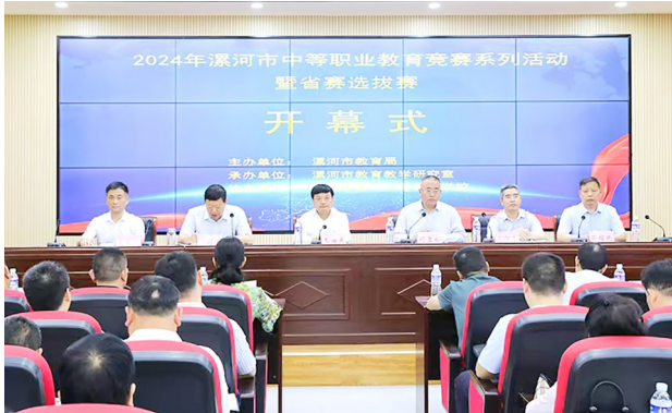
2024年漯河市中等职业教育竞赛系列活动暨省赛选拔赛开幕式