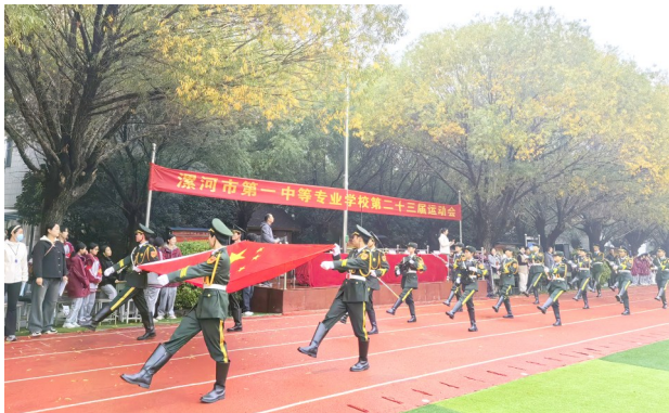
学校第二十三届运动会开幕式