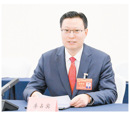
■文/本报记者 高雪茵 见习记者 徐斐斐

成中试基地、研究生院、人才公寓、孵化园,推动一批项目入驻园区,推动更多高端人才、科研机构、科创资本和创新项目汇聚赋能,形成全链条科研转化体系。三是推动中原食品科创园创新裂变。全力打造以中原食品科创园为创新引擎,益生菌+、塔格糖+、生物酶制剂+等15个产业园区合理布局,健康食品、生物医药、智能制造等产业集群发展的“一城十五园五集群”产业格局,努力为谱写中国式现代化漯河篇章贡献郾城力量。