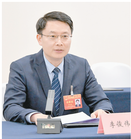
■文/本报记者 高雪茵 见习记者 徐斐斐 图/本报记者 焦海洋

“王凯省长作的政府工作报告总结成绩客观实在,部署工作措施具体,交出了来之不易的‘河南答卷’、描绘了鼓舞人心的‘美好蓝图’、饱含了人民至上的‘民生情怀’。”1月18日,省人大代表、临颍县委书记李俊伟在接受记者采访时说。