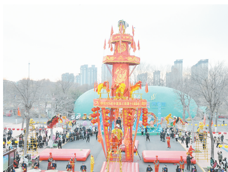
来自禹州市无梁镇无梁社区狮子会的舞狮表演。