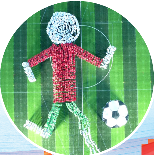
2024年7月5日晚,2024年河南省青少年校园足球“省长杯”暨河南省传统特色学校比赛在漯河高中北校区拉开帷幕。图为开幕式上团体操表演。