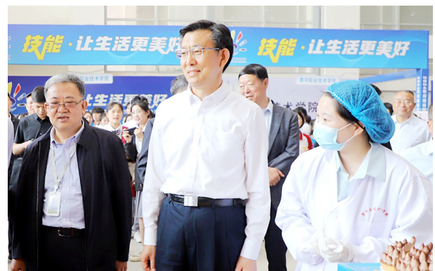
市委常委、宣传部部长,市委教育工委书记马明超参观职业教育成果展