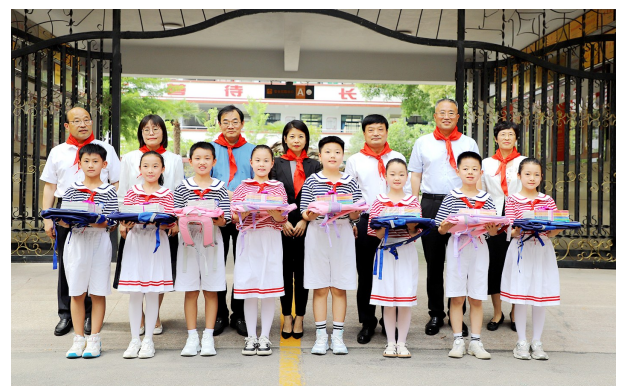
副市长宋瑛看望慰问少年儿童