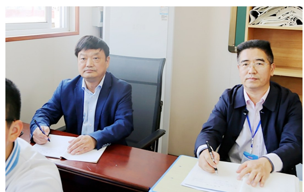
市教育局党组书记、局长王海东到漯河三中东通公路校区开展教学视导工作