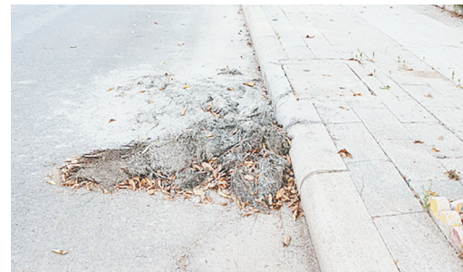
创业路与桂江路交叉口向北约90米路西,主路面上清淤遗留物未及时清理。