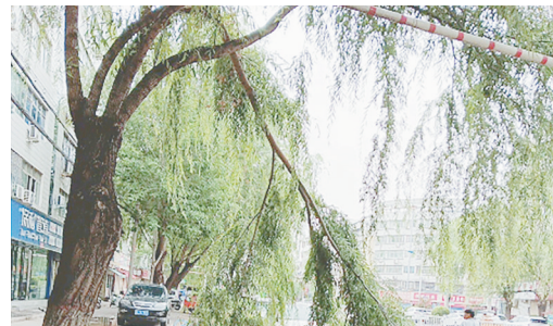
辽河路与巴山路交叉口向西约30米路北,行道树枝折断。