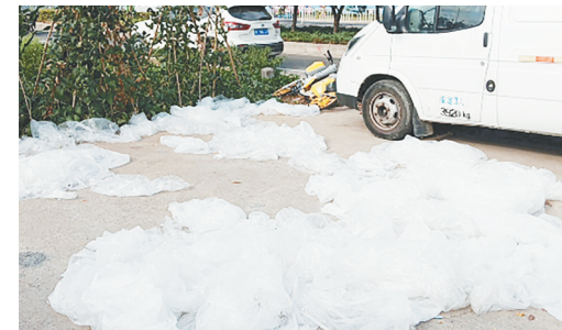
中山北路与牡丹江路交叉口向南约230米路西,废弃塑料袋无人清理。