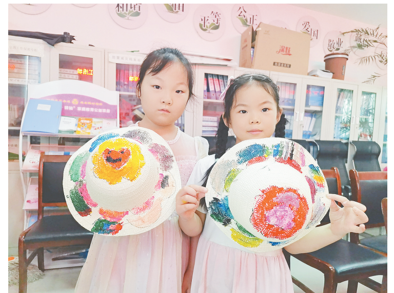
8月7日,源汇区老街道滨西社区组织开展“清凉一夏 美‘帽’如花”防晒帽DIY手工活动。 本报记者 孙震 摄