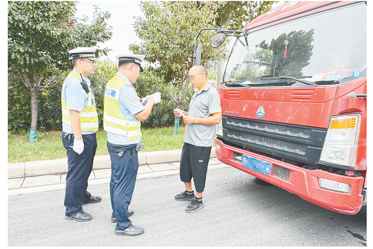
民警在樟江路查处大货车闯红灯违法行为。

本报讯(记者 范子恒)8月7日,市公安局交通管理支队第四执勤大队在樟江路开展专项整治行动,一个小时查处多起大货车闯红灯违法行为,分别给予违法司机罚款200元、驾驶证记6分的处罚。