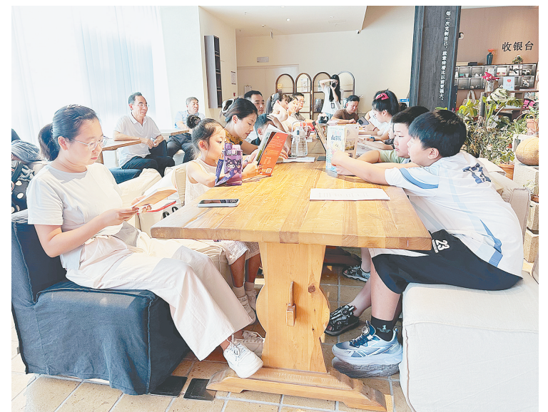
8月7日上午,在西城区采澍书店,召陵区“快乐阅读 同‘新’出发”新业态劳动者读书分享活动举行。