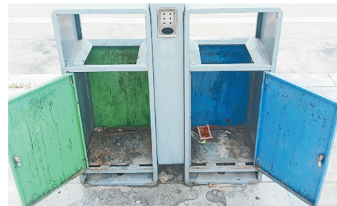
文化路与建设路交叉口向北约30米路西,垃圾箱内胆缺失。