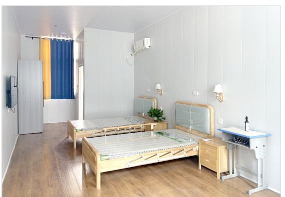
养老服务中心房间