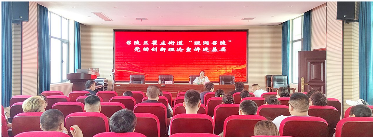
开展“理润召陵”宣讲活动

民生所系,点滴皆重。衡量基层治理效果的关键在于群众是否满意。这不仅是工作的出发点,也是落脚点。今年以来,召陵区翟庄街道坚持以党建为引领,秉持“民有所需 我有所应”的工作理念,持续探索“组织强基、队伍赋能、机制创新、网格织密、平台增效”基层治理新路径,通过一系列组合拳,有效推进了基层高效能治理,切实增强了辖区群众的获得感、幸福感和安全感。