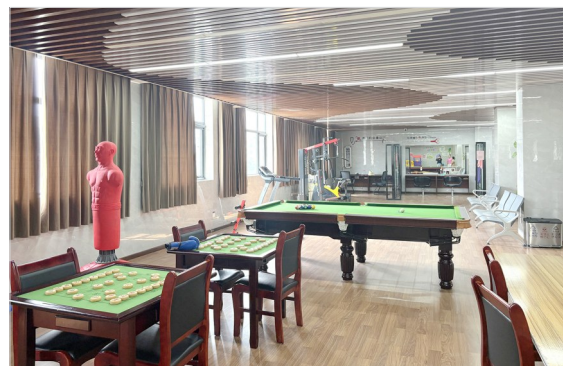
日间照料中心活动室

在家门口就能吃上营养美味的饭菜、享受便捷的基础医疗服务、参与多种文娱活动、享受专业化养老服务……今年以来,翟庄街道加大力度补齐短板提升基层服务能力,以增进民生福祉为出发点和落脚点,加快建立以居家为基础、社区为依托、机构为支撑的养老服务体系,让基层治理在养老服务中开花结果。