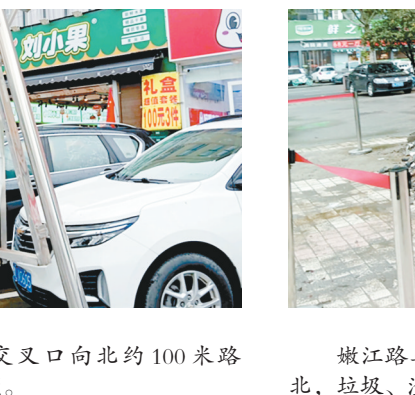
嫩江路与嵩山东支路交叉口向东约100米路北,垃圾、渣土未及清理。