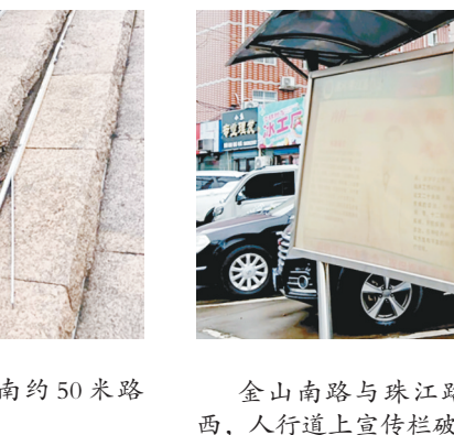
金山南路与珠江路交叉口向北约100米路西,人行道上宣传栏破损。