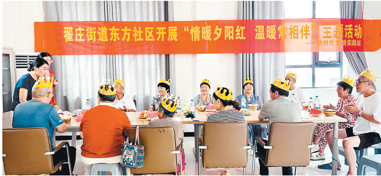
东方社区集体生日会(资料图片)。

作为东方社区“情暖夕阳红 温暖常相伴”主题活动的重要组成部分,每月一次的集体生日会始终以简单、温馨的形式传递关爱。社区工作人员不仅布置场地、准备蛋糕,还会了解每位寿星的需求,让他们开心过生日。对于行动不便、无法到场的高龄老人,社区工作人员会上门送上长寿面等慰问品。