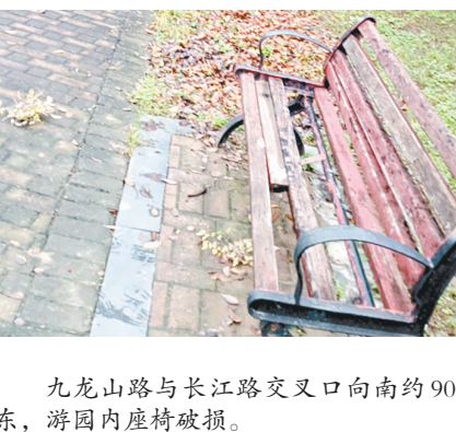
九龙山路与长江路交叉口向南约90米路东,游园内座椅破损。