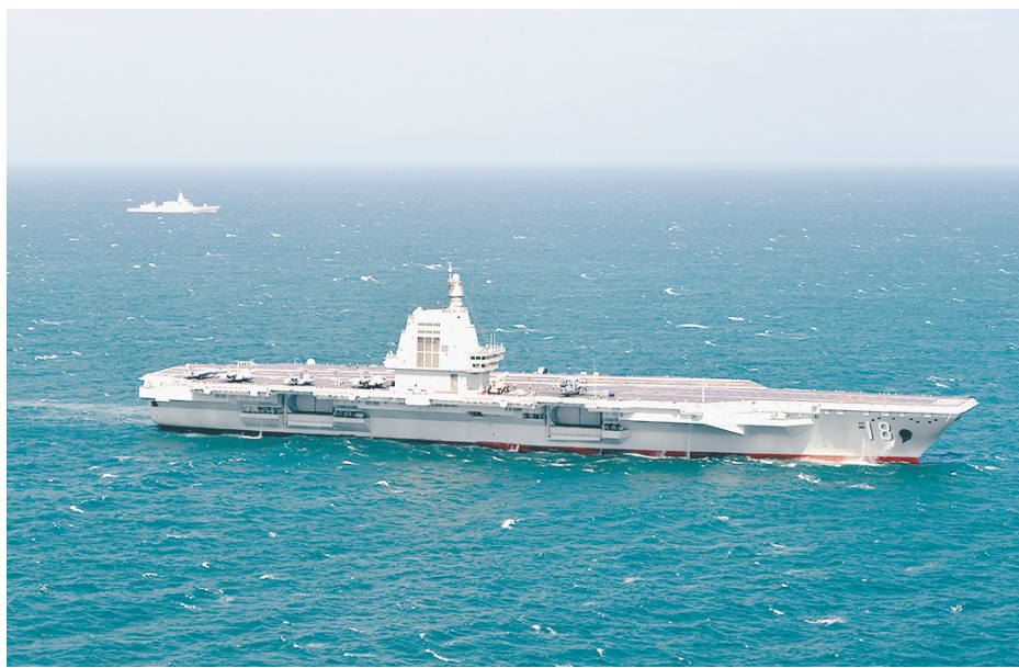
日前，海军福建舰开展入列后首次海上实兵训练。这是福建舰编队在航行。