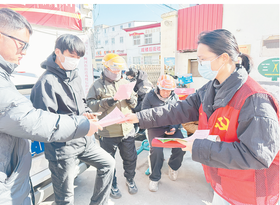
11月27日,源汇区顺河街街道东大街社区居委会联合顺河街司法所,开展了针对新就业群体的“文明出行 安全送达”交通安全知识培训、宣传。

二是集中攻坚寻求重点突破。在全域创新基础上,聚焦公司配网领域,以供电可靠性、电能质量提升为目标,将新配建设与创新挖掘有机结合开展专题成果培育。通过经验总结推动技术创新,通过技术创新推动配网管理提质增效,力求实现工作质效与成果培育双丰收。三是注重实效加强过程指导。聚焦各专业工作现场堵点难点开展问题指导攻关,通过强化培训排除疑难杂症、选推骨干外部交流拓展视野、邀请专家专项辅导优化课题细节等措施,确保各课题开展规范有序、过程高质高效。四是多维评估完善评价体系。从指标贡献、应用推广等多维度完善成果评价体系,鼓励围绕短板抓好质量提升、发挥优势培育亮点,形成可量化验证、可复制推广、可支撑指标提升的实质性改进成果,切实助力企业高质量发展。 魏建北 吴迪