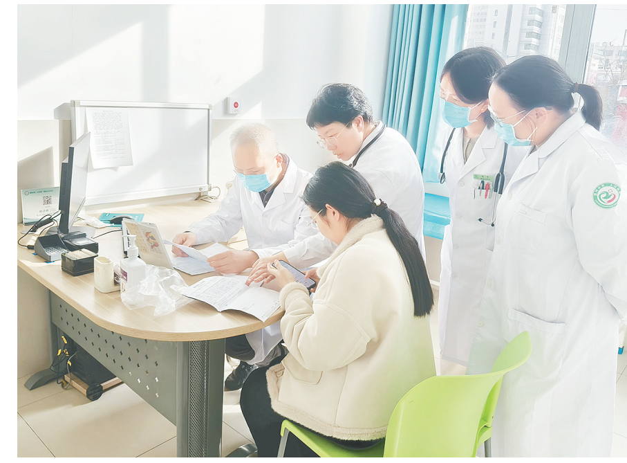
11月23日,市二院(市儿童医院)特邀省儿童医院小儿消化内科王跃生教授,开展专家门诊与疑难病例讨论活动。

市中医院将以此为契机,把握发展机遇,通过远程会诊、学术交流、科研合作等方式,与联盟成员单位及中医专家进行深度合作,共同推动中医经典理论的创新,努力将中医经典病房建设成为技术精湛、特色鲜明、群众信赖的区域性中医诊疗中心,为推动中医药学术发展贡献力量。