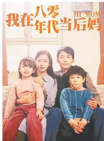
《我在八零年代当后妈》剧照