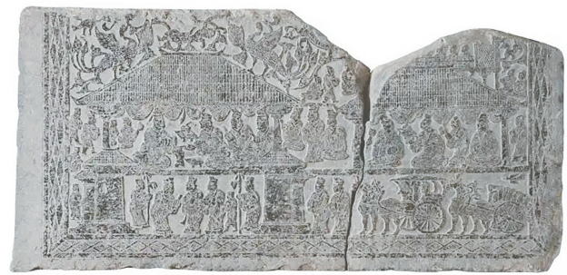
汉迎宾画像石