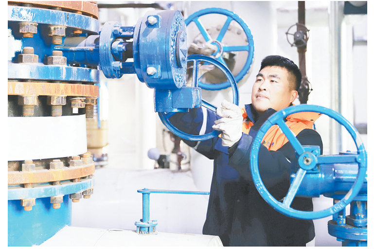
12月10日，河南省焦作市温县一家热力公司的员工在巡检调试热力设备。

“展望全年，汽车内需市场在政策组合效应推动下有效改善，新动能加快释放，对外贸易呈现出较好韧性，汽车全年产销量有望再创历史新高。”中汽协副秘书长陈士华说，近期一系列举措释放积极信号，有助于提振发展信心、稳定市场预期、全链条扩大汽车消费，为实现“十五五”良好开局打下坚实基础。