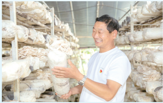
文峰乡李斌庄村香菇种植基地