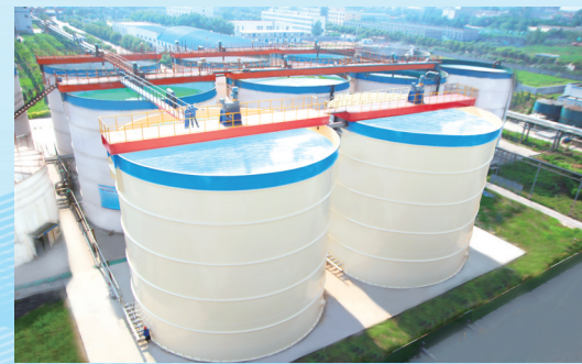
制盐系统卤水净化工艺