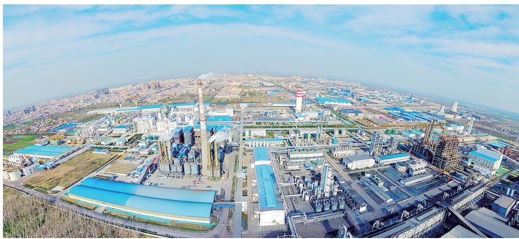
河南金大地化工有限责任公司

总投资300亿元的金海千亿级氟硅新材料项目是全省近年来单体投资最大、亩均投资强度最高的项目之一，也是今年省政府重点推进的项目。该项目主要打造氟基、氯基、硅基、碳基4条完整产业链，生产第四代制冷剂、高端氟树脂、电子级硅胶、航空航天绝缘材料等终端产