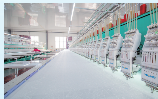
漯河东方刺绣有限公司标准化生产车间