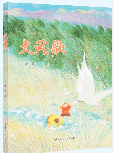
《大风歌》 李谦 著