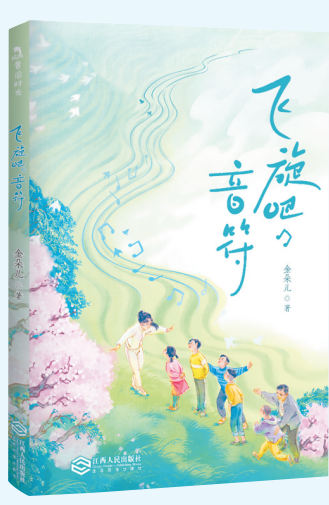
《飞旋吧,音符》 金朵儿 著