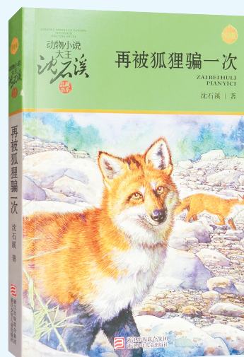
《再被狐狸骗一次》 沈石溪 著