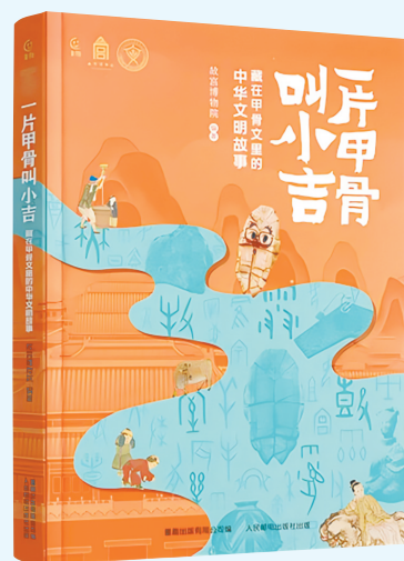
《一片甲骨叫小吉》 故宫博物院 著绘