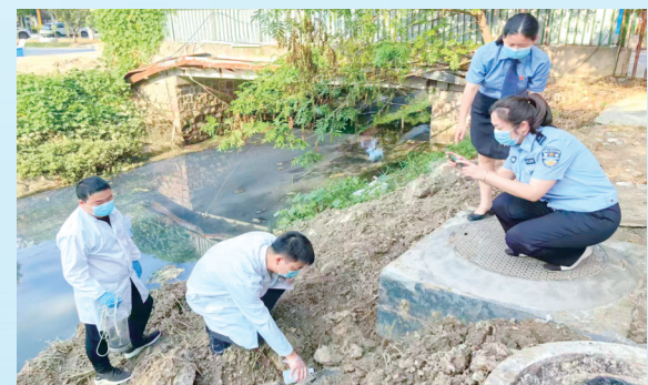
对水体进行取样调查