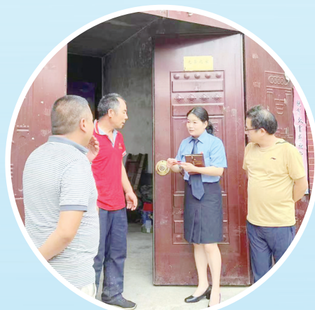
了解军人家家庭光荣牌匾发放悬挂情况

转型,从学习开始。最高人民检察院发布的指导性案例,公益诉讼办案规则,相关领域的法律法规、政策文件……她利用一切时间收集、整理、研读。 “纸上得来终觉浅,绝知此事要躬行。”她坚信,办案是最好的课堂。线索摸排是公益诉讼的起点,也是最难的一环。为了找到有价值的线索,她带领公益诉讼办案团队的同事用脚步丈量辖区。河堤田野、大街小巷、生产企业、行政机关……三年时间,她几乎跑遍了辖区的每个镇(街道)。 一次下乡调查河道污染问题,车辆驶过一片农田,路边一块“高标准农田”的标识牌引起了她的注意:“高标准农田”牌下的地里种着一排排树木。 “高标准农田有严格的用途管制,种树显然不合规。”职业的敏感让她立刻停下来观察。一条涉及耕地“非粮化”的公益诉讼线索由此浮出水面。她说:“做公益诉讼,就要做个有心人。处处留心皆线索。” 这种有心,不仅在于敏锐的观察,更在于系统思考和主动谋划。她将办案方向与召陵区发展大局、民生关切热点紧密结合。针对新建道路施工企业临时占用耕地未缴税问题,她深入调查,依法督促相关单位履职,成功追缴耕地占用税600余万元,保护了国有财产。聚焦农民工欠薪问题,她通过公益诉讼检察建议,推动相关部门完善工资保证金制度,从源头上减少了劳资纠纷,维护了劳动者合法权益。 在公民个人信息保护领域,她发现一些单位在政务公开时,未对居民身份证号、银行卡号等敏感信息进行相应处理,存在泄露风险,极易被诈骗分子利用……一份份检察建议发出后,相关单位迅速整改,此类现象在全区得到有效遏制。 “每个案子办之前都要想清楚:有没有社会价值?能不能推动问题解决?”在她看来,公益诉讼的终极目标不是办案数量、不是发出多少份检察建议,而是