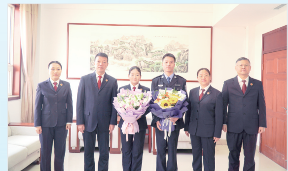
获得业务竞赛一等奖归来,与院领导合影