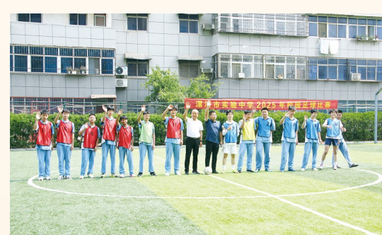
“校长杯”校园足球比赛