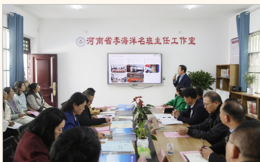
名班主任工作室活动