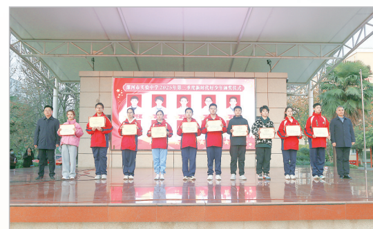
表彰新时代好少年

市实验中学正以昂扬的姿态、务实的作风、创新的精神，在教育高质量发展的道路上勇毅前行，书写着更加辉煌的篇章。