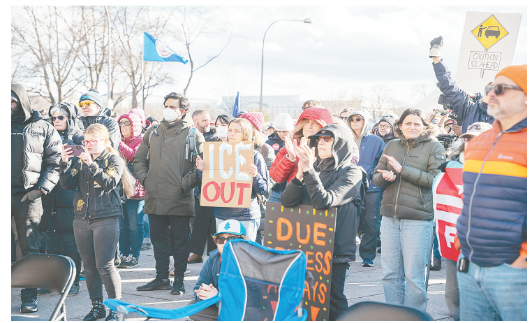
1月11日，在美国首都华盛顿，民众抗议移民与海关执法局暴力执法。 新华社发