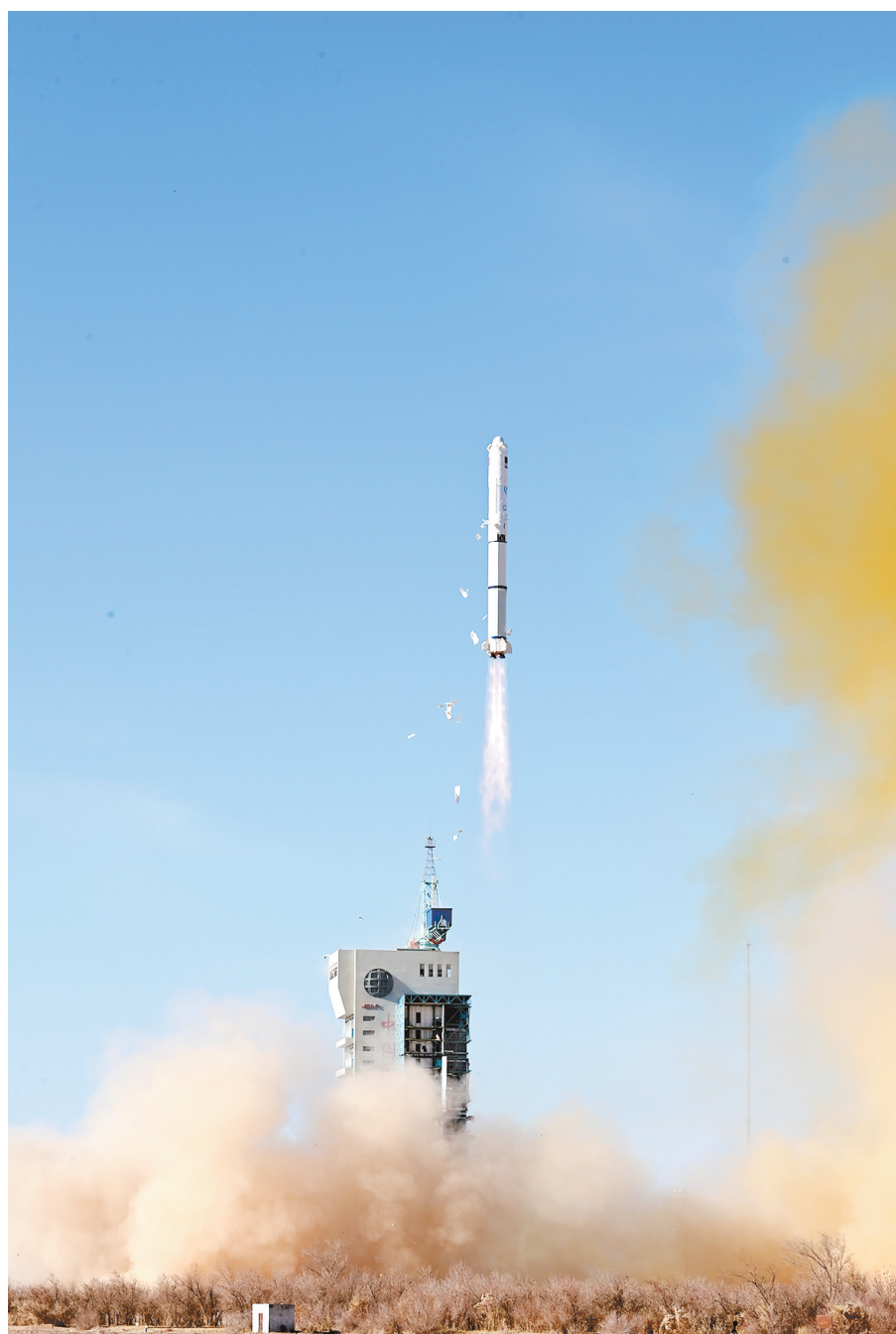
1月15日12时01分,我国在酒泉卫星发射中心使用长征二号丙运载火箭成功将阿尔及利亚遥感三号卫星A星发射升空,卫星顺利进入预定轨道,发射任务取得圆满成功。