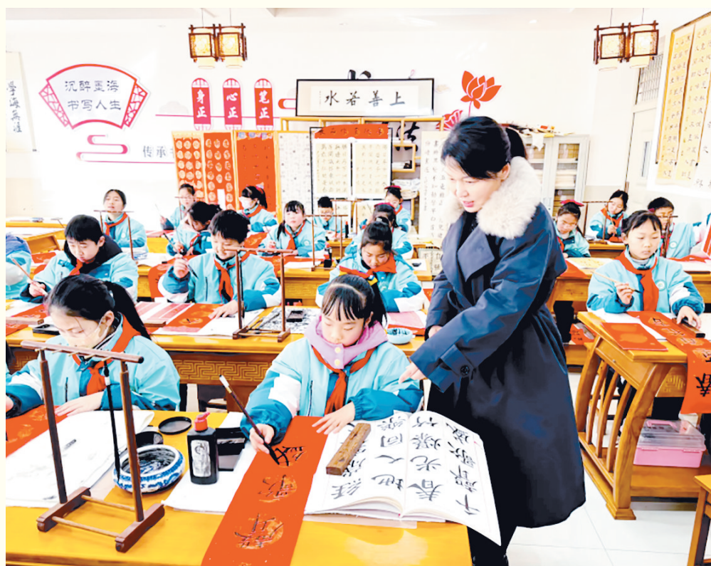
近日,郾城区太行山路小学开展社团成果验收活动。