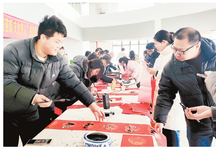
1月24日上午,漯河高中特邀民盟漯河市委部分知名书法家到西校区开展“翰墨迎新·文化育人”书法进校园活动,为漯河师生写春联、送祝福。

“以前总觉得法条枯燥,今天通过这个案例我不仅记住了民法典相关规定,还明白了如何结合具体情形分析适用,进一步提高了学习效率!”参与活动的一名同学深有感触地说。