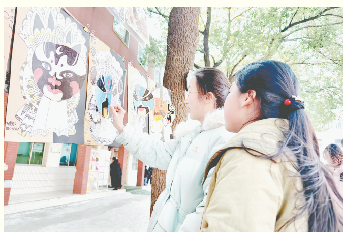
近日,源汇区受降路小学举办“剪韵童心传非遗 巧手绘梦绽校园”社团成果展。

行详细分解。会议传达了省教育厅对我市食育工作的高度认可及相关政策精神,并对各园所的汇报进行了点评,鼓励各园所在今后的教育教学中持续探索食育创新路径,将食育全面融入新学期工作计划,推动“沙澧食育”品牌建设迈向更高水平。 贾婉霞