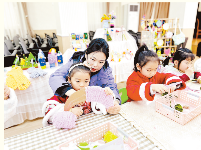
1月28日,市直幼儿园举办“缤纷社团展风采 初绽花蕾竞芬芳”社团成果汇报活动。