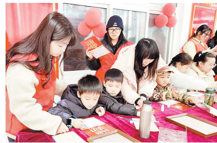
2月2日下午,源汇区顺河街街道建西社区组织志愿者开展非遗金箔画体验活动,提高孩子们对非遗的认识,并锻炼其动手能力。