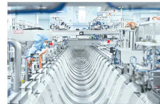
医疗器械产业全省领先、全国知名。图为曙光汇知康生产车间。

一年来，源汇区聚焦医疗器械、智能制造、现代食品、循环经济、文旅、商贸物流“4+2”重点产业，全力推动产业链、创新链深度融合，加快构建现代化产业体系，塑造发展新优势，抢占发展新赛道。工业发展扩能提级。链群企业提质增效。医疗器械和装备制造产业钜涂层高端医疗器械、裕泰液压等项目建成投产，曙光汇知康获评国家级“专精特新”小巨人企业，赛伦特液压被认定为国家级高新技术企业，3家企业被认定为省级“专精特新”企业，6家企业被认定为河南省创新型中小企业；食品产业新引入乐尚榴莲、豫纳盈川食品、食品智能包装等项目，加快融入全市食品产业体系。循环经济蓄势待发。完成漯河生态循环经济（EOD）产业园3平方公里控制性详细规划，九昱塑胶高分子材料、漯湾金属再生资源等一批产业项目实现当年签约、当年开工、当年达效，形成了再生塑料、再生金属、电子元器件循环利用三大循环经济产业板块。该产业园成功入选河南省循环经济园区。