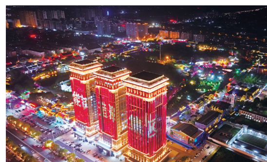
电商经济强势崛起，打造全市直播经济新高地。图为电商大厦。

展思想，持续加大民生投入，兜牢民生底线，让发展成果更多更公平惠及全体人民。省、市、区定民生实事全部完成，城乡居民基础养老金、城乡低保标准稳步提高，义务教育优质均衡发展，基层医疗卫生机构标准化建设实现全覆盖，新增城镇就业人数超额完成市定目标任务，养老服务体系进一步完善，社会保障水平稳步提升，城乡居民养老保险、医疗保险参保率均完成市定目标任务。群众生活品质不断提高、更加可感可及。大河奔流，不舍昼夜；征程万里，风正帆悬。站在新的起点，源汇区将以更加昂扬的姿态、更加务实的作风，锚定“三区”发展定位和“两高三中心”产业定位，坚定不移强产业、扩投资，抓城乡、惠民生，踔厉奋发、勇毅前行，在推进中国式现代化漯河实践中展现更大担当、作出更大贡献，奋力谱写现代化源汇建设的崭新篇章！