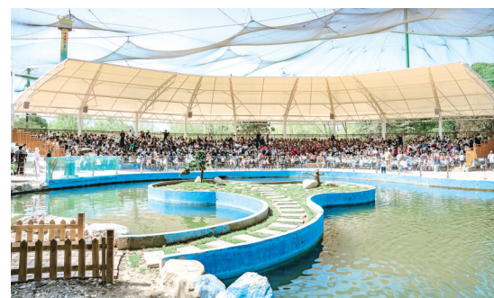
文旅融创融合中心区位优势进一步巩固，河上街景区享誉豫中南，神州岛园成为研学游体验式消费基地。图为研学学生等待观看表演。