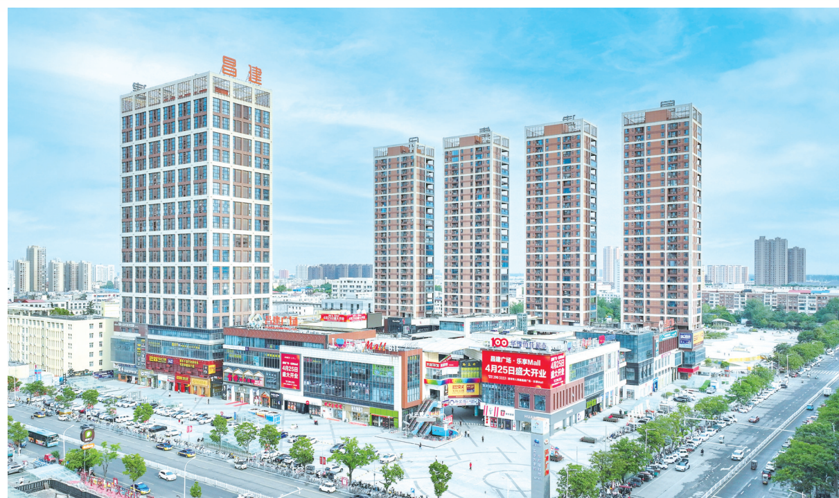
商贸物流产业发达，现代服务业繁荣，服务业总量和增幅稳居全市首位。图为全市最大的城市综合体——昌建广场。

商圈迭代，构筑多元消费新地标。消费是经济增长的持久动力。源汇区顺应消费升级趋势，推动传统商圈提质与新兴商圈崛起。以华豫佰佳、昌建乐享Mall为代表的“首店”品牌，赋能人民路商圈提档升级；豫中南汽贸服务产业园全年销售车辆3.1万辆，110余家汽车销售企业汽车置换销售达5.2亿元，享受补贴全市占比85%；241家企业、商户参与消费品以旧换新活动，实现销售3.72亿元，享受补贴全市占比70%以上，巩固了区域性汽贸消费中心地位。电商赋能，打造数字经济新增长极。高标准打造电商数字经济集散中心，颐高数字总部港、豪之英电商中心等头部平台相继落户，听风的蚕文化传播、汇焱云计算、福建久一坊等137家电商企业纷至沓来，其中规模以上电商企业达8家。“产品+互联网+自媒体直播”新模式，正将源汇乃至漯河的优质产品卖向全国。全年实现电商交易额86.4亿元，同比增长5%，电商产业成为区域经济名副其实的新引擎。