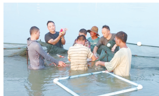
特色产业带动农民增收致富。图为宋庄村锦鲤养殖基地工人正在捕捞锦鲤。该基地通过电商平台把锦鲤销往各地。