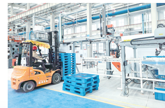
循环经济风生水起，抢占绿色发展新赛道。图为九昱塑胶生产车间一角。