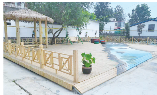
大力开展人居环境整治，村容村貌焕然一新。图为半坡朱村一角。