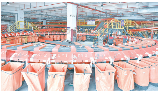
圆通快递物流园智能化分拣中心