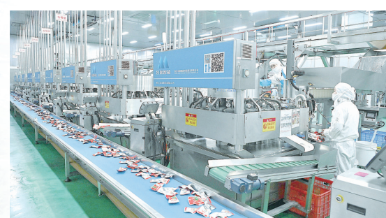
漯河亿家馨食品有限公司生产线