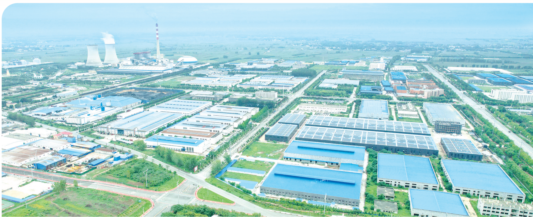
经开区产业集聚区