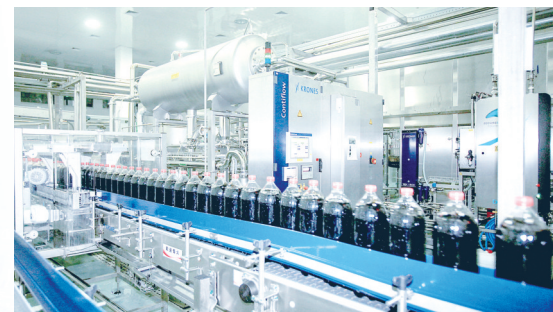
漯河太古可口可乐饮料有限公司生产车间