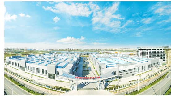
中国(漯河)智能食品装备产业园

百舸争流，奋楫者先。2026年是实施“十五五”规划的开局之年，站在新的历史起点，经开区将持续聚焦“两高四着力”重大要求，紧紧围绕省委“1+2+4+N”目标任务体系和市委“12345”战略取向，突出“三区”定位，扛牢经济发展主阵地、主战场、主引擎责任，聚焦现代食品、智能装备、超高压流体、现代服务业“四大产业”，深入实施“双千亿”战略，全力打造现代产业发展、创新创造、对外开放、品牌集聚、高效能治理的新高地，踔厉奋发，实干攻坚，奋力为全市高质量发展作出新的更大贡献。