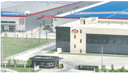
卫龙美味三期工业园

刚刚过去的2025年，是经开区发展历程中极不平凡、极有成效的一年。面对复杂严峻的外部环境和艰巨繁重的发展任务，经开区紧紧围绕“两高四着力”重大要求，坚决贯彻省委“1+2+4+N”决策部署和市委“12345”战略取向，牢牢扛起经济发展主阵地、主战场、主引擎的责任，锚定“三区一高地”定位，深入实施“双千亿”战略，全区经济社会发展呈现稳中有进、进中提质、向上向优的强劲态势。地区生产总值、规上工业增加值、固定资产投资等核心经济指标均居全市第一位。实际利用外资1892万美元，占全市外资总量的85%以上。先后荣获河南省制造业转型升级试点县区、首批休闲食品产业集群地标称号，并在全省商务工作会议上作为唯一县区代表作典型发言。在2025年全省开发区高质量发展综合考评中居国家级经开区首位，在全国国家级开发区综合考评中居第40位。