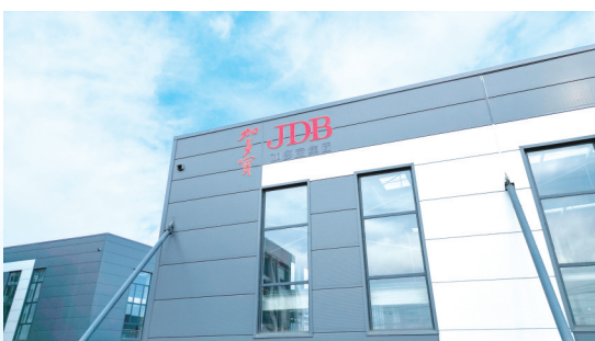
加多宝入驻经开区