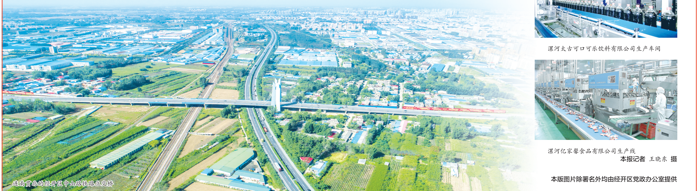
连南贯北的经开区中山路铁路立交