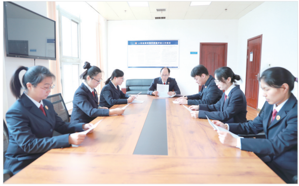
开展案件质量评查工作