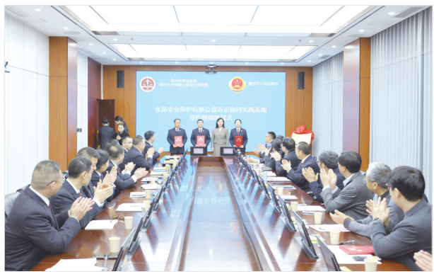
市人民检察院与郑州大学法学院、郑州大学检察公益诉讼研究院校校合作签约揭牌仪式