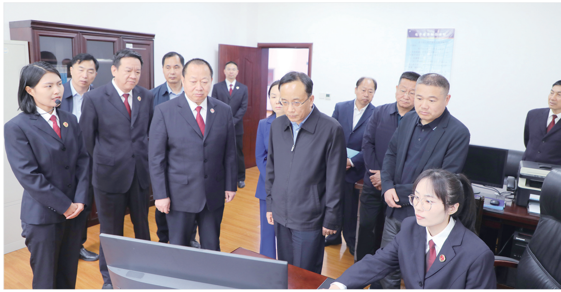
市人大常委会领导视察行政检察工作

一年来，全市检察机关劳动者权益保障等4项工作在全国、全省会议上交流，16件案件入选最高人民检察院、省人民检察院典型案例、优秀案例，农民工劳动报酬权益保护“全链条治理”模式入选省委改革典型案例红榜，37个集体、130名干警获得市级以上表彰，市四大班子主要领导20次批示肯定检察工作。