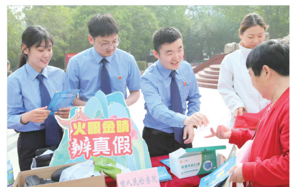
开展知识产权普法宣传