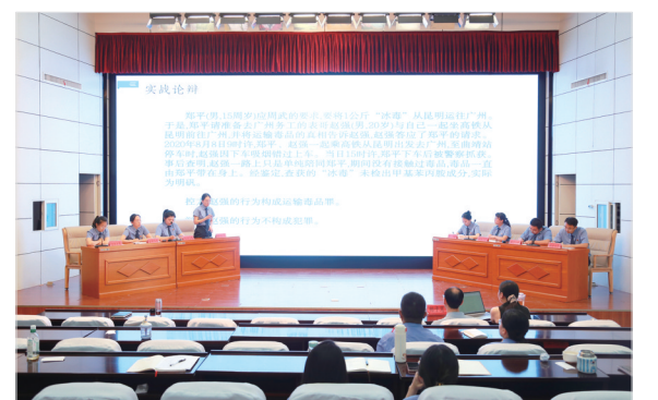
举办刑事论辩演练赛

持续强化公益诉讼检察。加强公共利益保护，以“诉”的确认彰显公益保护刚性，共办理公益诉讼案件172件，向行政机关发出检察建议134件，已督促及时整改到位123件；对逾期未整改到位的公益损害问题，依法提起诉讼5件，全部得到法院支持。立足我市作为首个“中国食品名城”的实际，与郑州大学法学院、郑