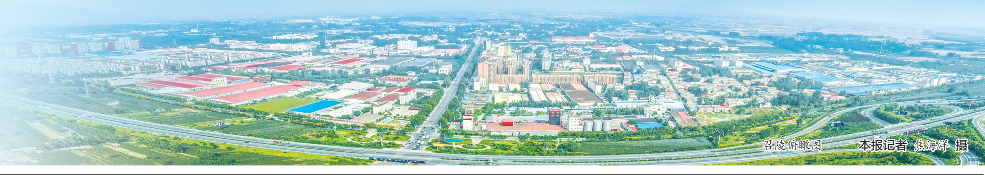
召陵俯瞰图