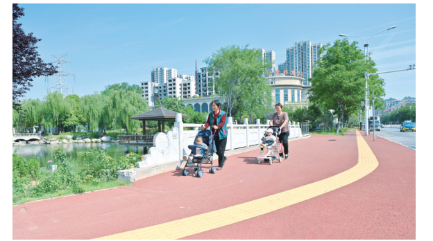
宜居宜业的城市环境

省定、市定、区定民生实事落地见效。万金镇中学教学楼、青年镇裴王小学宿舍楼等建成投用，3家区直幼儿园实现托幼一体化；区中医院补短板弱项提升项目主体工程完工，区人民医院泌尿外科成功创建全省（区）级临床重点专科，争取上级资金832万元对4个镇卫生院医疗设备进行更新；3个镇敬老院完成升级改造，新建9个村级养老服务驿站、11个老年助餐点，基本公共服务供给持续提质扩容。新增高技能人才1650人，新增城镇就业人员5331人、农村劳动力转移就业1716人，发放创业贷款6010万元。