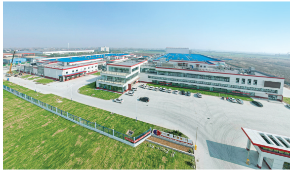
双汇第三产业园