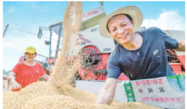
丰收的喜悦

坚定不移推动“三新”深度融合，着力催生更多新质生产力。大力培育创新主体。实施研发项目450个以上，规上工业企业研发投入4亿元以上，正常生产的规上工业企业研发活动覆盖率100%；科技贷总额达3亿元以上，覆盖高新技术企业和科技型中小企业80家以上。支持企业建设高能级创新平台。支持中誉宠物创建省级工程技术研究中心、宠物食品产业研究院，景珍生物、奥诚电力、春晓医疗等企业申报市级工程技术研究