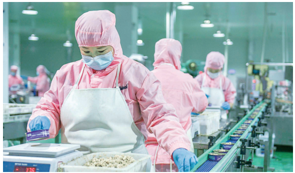
加快推进宠物经济产业发展

逐梦惟笃行，奋进正当时。2026年是“十五五”开局之年，召陵区将在省委、省政府和市委、市政府的坚强领导下，紧紧围绕全区“三区”发展定位、“四领先”发展目标，坚定信心、攻坚克难，真抓实干、奋勇争先，奋力开创中国式现代化建设召陵新局面。