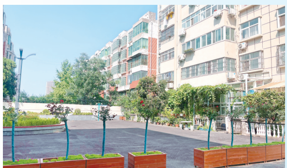
老旧小区焕然一新