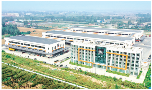
打造现代物流产业发展新高地