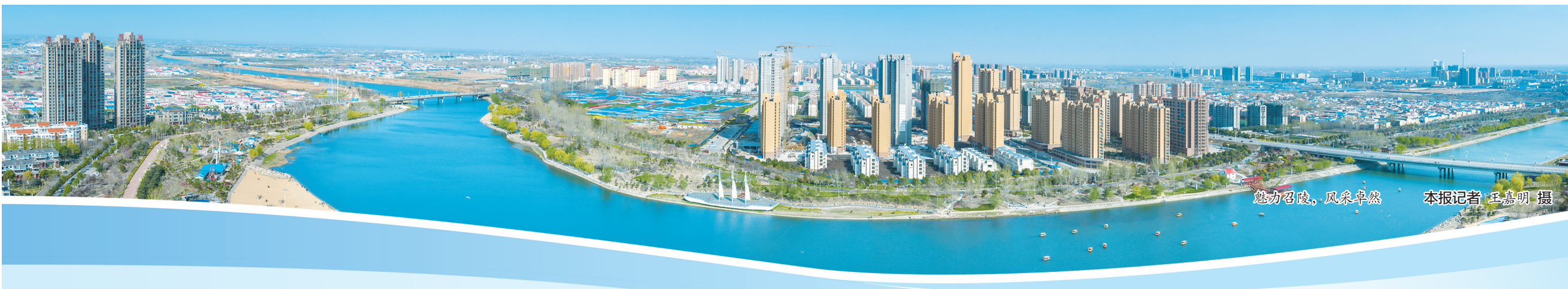
魅力召陵，风采卓然 本报记者 王嘉明 摄