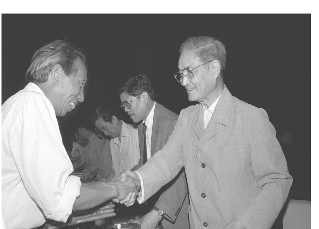
一九九一年六月二十六日, 中共中央组织部、中共宣传统战部等单位在北京召开大会, 表彰全国高校优秀思想政治工作者。这是宋平同志(右)向获奖的个人颁奖。