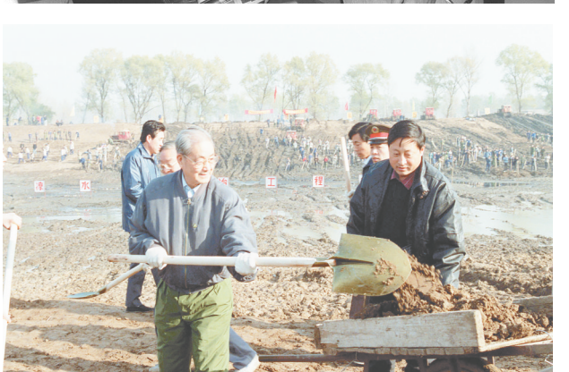
一九九一年十一月十三日, 宋平同志(左)来到湖北省通城县(今通城县)考察。

中国共产党的优秀党员, 久经考验的忠诚的共产主义战士, 杰出的无产阶级革命家、政治家, 党和国家的卓越领导人, 中国共产党第十三届中央政治局常委, 原国务委员宋平同志, 因病医治无效, 于2026年3月4日15时36分在北京逝世, 享年109岁。