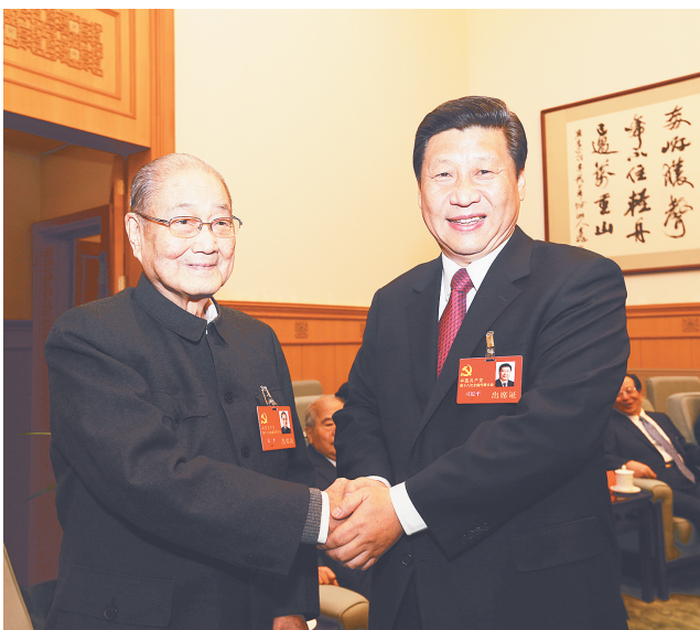
前, 二〇一二年十一月十四日, 在党的十八届五中全会期间, 习近平同志同宋平同志在一起。