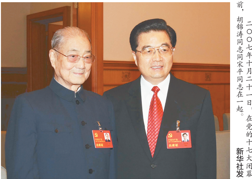
前, 胡锦涛同志同宋平同志在一起。