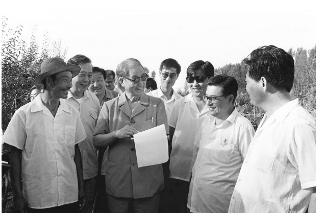
一九九〇年七月, 宋平同志(前左二)来到内蒙古自治区, 宋平同志(前左一)到市临河区马场地村了解基层党支部建设情况。