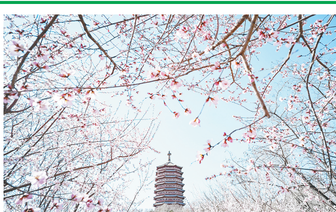
3月18日，北京园博园桃花谷山桃花次第绽放。