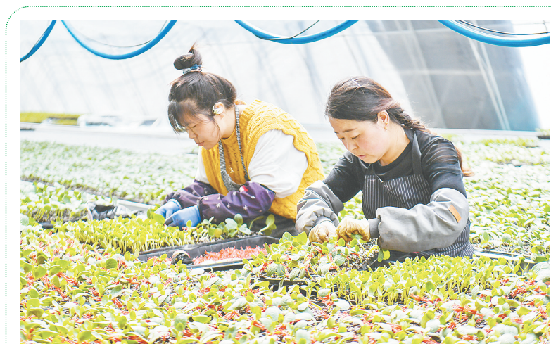
3月18日，山西省运城夏县夏乐精品瓜业合作社的工作人员在嫁接西瓜苗。近日，夏县迎来西瓜育苗生产季，田间地头一片忙碌景象。