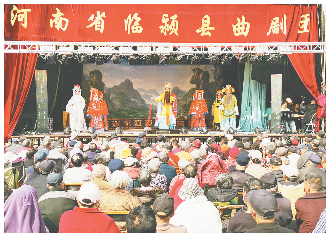
3月21日,在郾城区商桥镇沟张村,曲剧《宋宫秘传》正在上演。3月20日至22日,该村村委会邀请临颍县曲剧团在村里搭台唱戏,让乡亲们在家门口过足戏瘾。