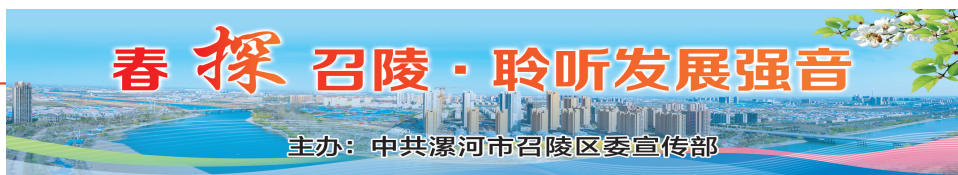
主办:中共漯河市委宣传统战部