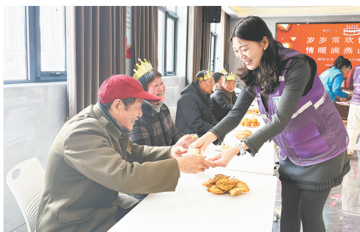
3月20日,在召陵区翟庄街道燕山路社区新时代文明实践站,社区工作人员为辖区65岁以上老人举办集体生日宴。