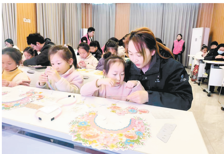
3月21日,郾城区龙塔街道巴山路社区举办“簪花识趣 亲子雅集”手工活动。

市环卫部门充分发挥机械化作业优势,科学调配洗扫车、高压清洗车等作业车辆,重点对食博会会场周边、城市环线、主次干道、景区等核心区域开展立体化保洁作业。针对下水道口、道牙石、窨井盖周边等易藏污纳垢部位,实施高压靶向清理,彻底清除油污、污渍与积尘,实现路面本色、道牙洁净。环卫工人手持工具细致清理护栏缝隙、绿化带边角、公交站周边等机械作业盲区,“机械+人工”高效协同、无缝衔接,全方位提升道路